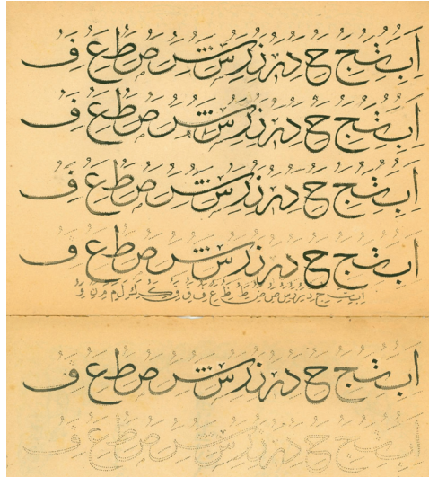
Belge 4. Belge 3'teki Meşk Defteri 'nin ilk iki sayfası: Bu Meşk Defteri 'nde harfler ince çift noktalarla yazılmıştır ve öğrenci kâşî kalemini bunlara uygun kalınlıkta açıp çift noktaların arasından gidecektir. Belge 4'teki yazılar tarafımızdan 1958 yılında hat dersleri almaya başladığımızda yazılmıştır. Yazı öğretiminde tekrârın önemini çok iyi anlayan Osmanlı eğitimcileri çocuklara bir yazı örneğini, yani "meşk"i pek çok kez yazdırmışlardır. "Aşk olmadan meşk olmaz" şeklindeki söz, sevgi, sabır, özen isteyen bu çalışmayı çok güzel anlatmaktadır.