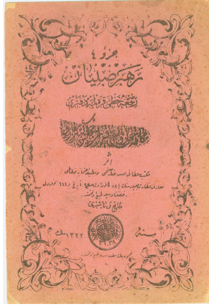
Belge 5. Sıbyan mektepleri için Rik 'a yazısı Karalama Defteri (1322=1906) (Yahya AKYÜZ Arşivi)