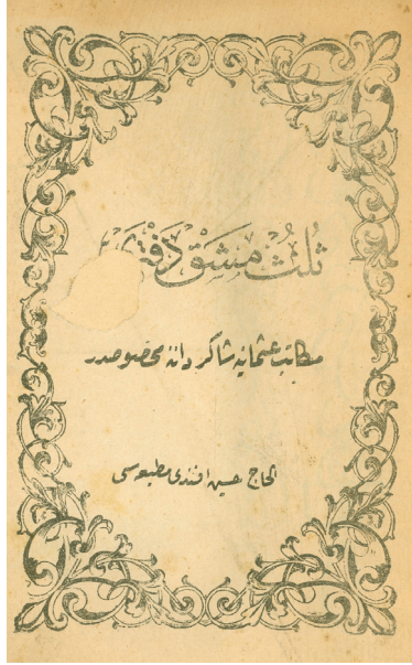
Belge 3. Öğrencilere mahsus Sülüs yazı türü Meşk Defteri (Tarihsiz, muhtemelen 1900'lerin başı)