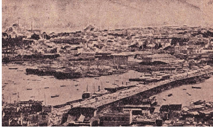
Resim-3: İstanbul Şehri

Balkan Savaşlarının Osmanlı zihniyet dünyasında yarattığı karmaşa eserdeki tek haritaya yansımıştır. Sayfa 11'deki "Esir Vatan" alt başlıklı haritada Balkanların haritası verilmiştir. 59 Haritada dört temel yer adı ile karşılaşmaktayız. Bunlar: Küçük Asya, Rumeli, Bulgaristan ve Sırbistan'dır. Küçük Asya'nın İzmir ile Kırklareli kentleri arasında kalan temel kentler, Bulgaristan ve Rumeli'nin hemen hemen bütün önemli kentleri, Sırbistan'ın ise Niş kenti haritada yer almaktadır. Rumeli toprakları koyu renk ile gösterilerek farklı bir konuma taşınmış, vatan parçası olarak tanımlanmıştır. Ayrıca Rumeli haricinde şehir adlarının yakınına içi dolu daireler ya da yıldızlar yerleştirilmiştir. Bu daire ve yıldızların işlevi konusunda bir açıklama yapılmamıştır. O yüzden ne anlama geldikleri tam olarak çıkartılamamaktadır.