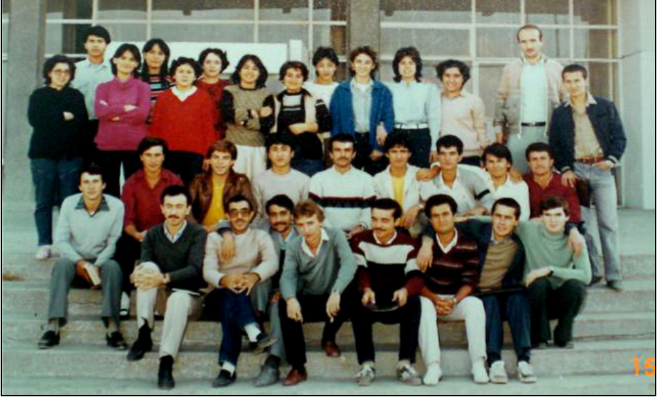
Tarih I. (1982-1983)

Bölüme ait olan 202 numaralı sınıfa 22 Ocak 2003, 201 numaralı sınıfa ise 15 Nisan 2004 tarihinde projeksiyon cihazı alınmıştır. Ayrıca 202 no'lu dersane akıllı tahta ve her iki sınıfta da birer adet masaüstü bilgisayar bulunmaktadır.