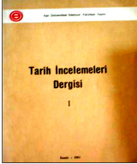
Tarih İncelemeleri Dergisi'nin ilk sayısı.