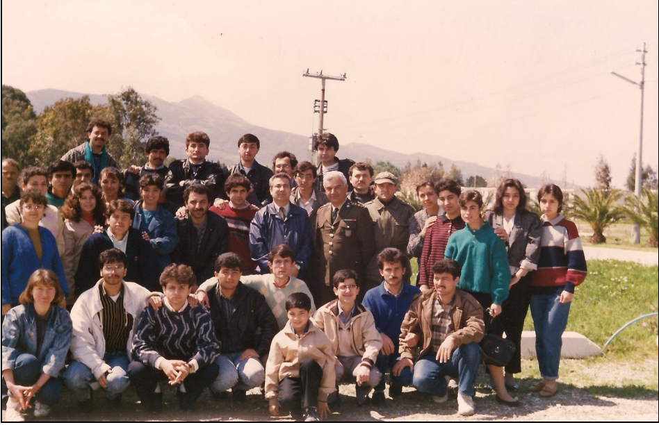
İzmir Kent Gezisi. (1988)

öğrenciler Dergide kendi yöreleriyle ilgili küçük ama önemli makaleler yazıyorlar. Bunlar gerçekten orijinal denilebilecek tarzda yayınlar. 20