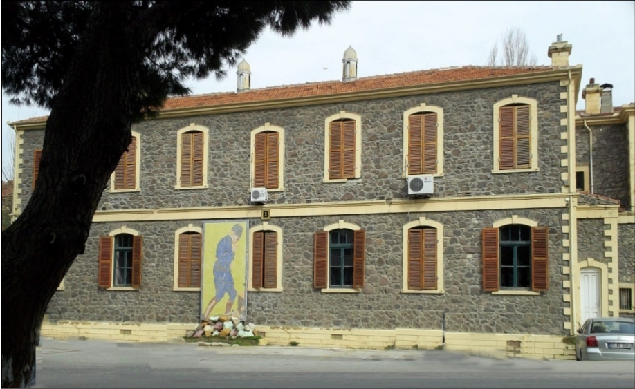
Resim 4. İngiliz Hastanesi'nin dış görünüm.