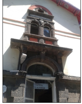
Resim 5. Fransız Hastanesi A Blok'un dış görünüm ve ana girişi.