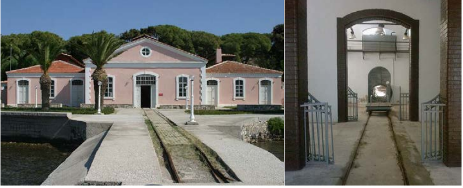
Resim 9. Urla Karantina Hastanesi ve ray sistemi.