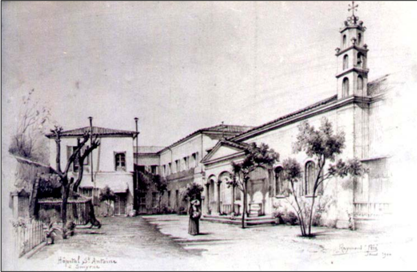
Resim 2. Raymond Pere'nin St. Antoine Hastanesi ek yapı çizimleri (Akyol Altun 2013)