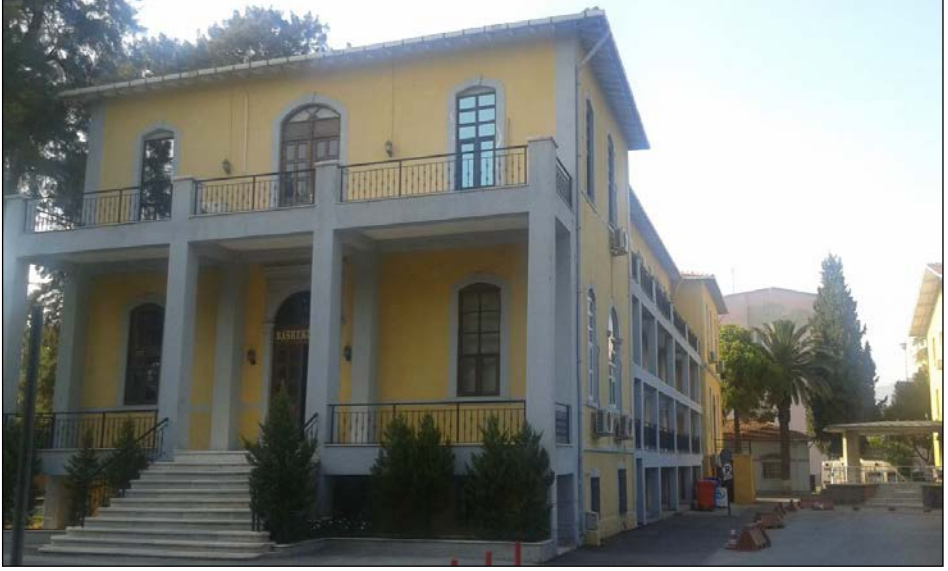
Resim 13. Emraz-ı Sariye ve İstilaiye Hastanesi (Altun arşivi).