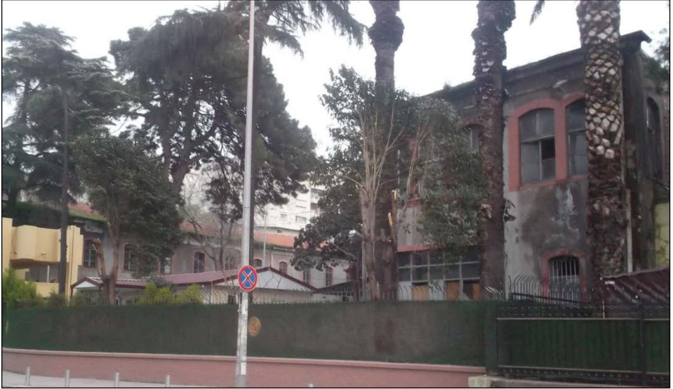
Resim 8. Askeri Hastane.