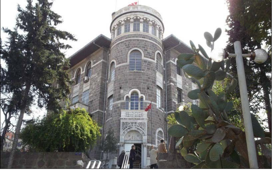
Resim 6. St. Roche Veba Hastanesi.