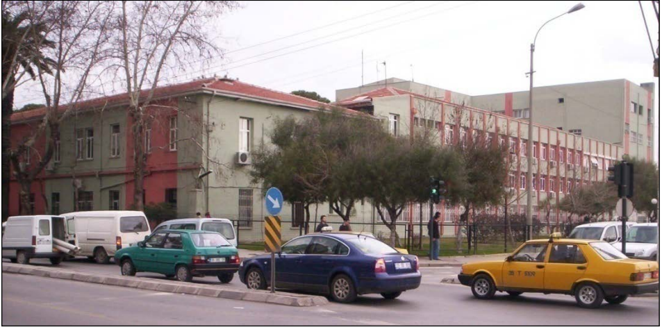
Resim 12. Eşrefpaşa Hastanesi (Altun 2013).