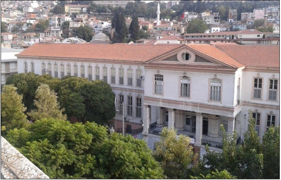
Resim 10. Gureba-yı Müslimin Hastanesi genel görünüm (Altun arşivi).