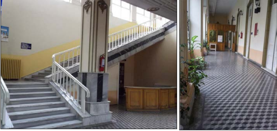
Resim 11. Gureba-yı Müslimin Hastanesi içinden görünüm.