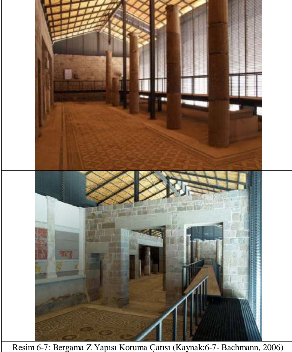
Resim 6-7: Bergama Z Yapısı Koruma Çatısı

Rüzgar etkisinin koruma çatısına etkisi kadar, koruma çatısı içerisindeki hava değişimlerine de etkisi olabilir. Wunderer, Efes Yamaç Ev 2 koruma çatısının çevresindeki rüzgar hareketlerinin strüktür içi hava değişimlerine yol açtığından bahsetmektedir. (Wunderer, 2000) Wunderer'e göre koruma çatısı içindeki hava sirkülasyonu kuzeyden güneye göre değişim göstermektedir.