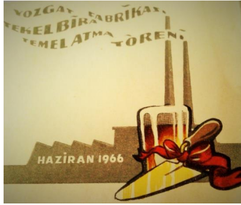
Resim 1. Açılış töreninde dağıtılan bir hediyeinin kapak resmi

25 Haziran 1966'da temeli atılacak olan bira fabrikası ile memlekette umumi bira tüketim hacminin artması, çıkacak olan küspenin hayvan besiciliği için kullanılması, üretim sırasında elde edilecek asit karbonik ve bira mayasının gazoz, meyve suları ve ekmekçilikte kullanılması, kullanılacak arparların biracılık bakımından ıslahı gerekeceğinden bölgede arpa ziraatının ve çiftçiliğin gelişmesi, nakliye ve inşaat iş kollarının istihdam sağlanması bekleniyordu 20 .