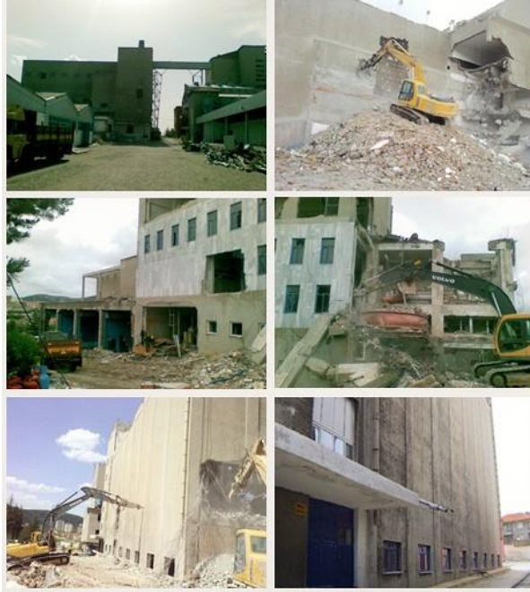
Resim 4. Fabrikanın Silolarının ve Tüm Müştemilatının Yıkım Görüntüleri 2008 33