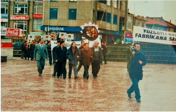
Resim 3. Fabrikanın Özelleştirilmesi Sürecinde İşçilerin Protesto Yürüyüşü