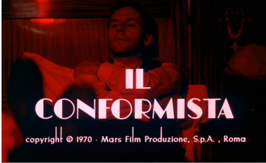
Görsel 16. Filmin açılış sahnesi kırmızı tonlar (Paris otel odası)

Elde edilen bulgular, ışık ve gölgenin filmde çok katmanlı bir anlam üretim sistemi oluşturduğunu ortaya koymaktadır. Işık, görünürlüğü düzenleyen, mekânı yeniden inşa eden, özneyi konumlandıran ve ideolojik anlam üreten bir araç olarak işlev görmektedir. Gölge ise bu sistemin tamamlayıcı unsuru olarak, görünmeyeni ve bastırılanı temsil eden aktif bir bileşen hâline gelmektedir. Bu bağlamda film, sinematografik estetiği yalnızca görsel bir tercih olmaktan çıkararak, doğrudan düşünsel ve ideolojik bir ifade biçimine dönüştürmektedir.