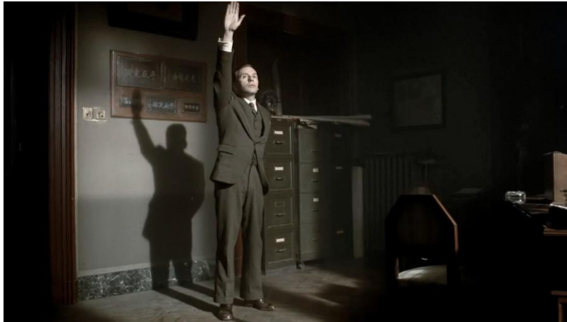
Görsel 2. Marcello Clerici karakterinin ideolojik ve psikolojik gölgesel konumlanması.