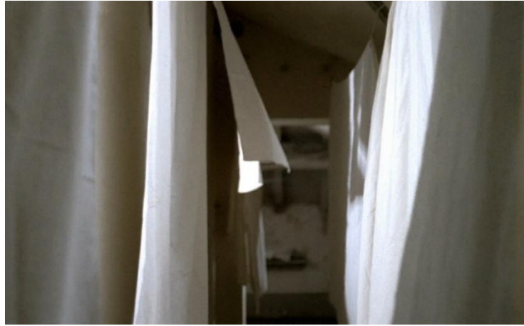
Görsel 7. Marcello'nun çocukluk travmasına dair geri dönüş sahnesinde, dalgalanan beyaz çarşaflar ve kırık ışık yüzeyleri.

The Conformist 'te ışık ve gölge, karakter psikolojisini dışsallaştıran ve öznenin içsel bölünmüşlüğü görünür kılan temel anlatı araçları olarak işlev görmektedir. Bu psikanalitik temsil mantığı, özellikle Marcello'nun geçmişe ilişkin anılarında daha da yoğunlaşmaktadır. Çocukluk travmasına dair geri dönüş sekanslarında ışık, nötr ya da gerçekçi bir işlev üstlenmekten çok uzaktır. Aksine anıların ışığı, belleğin travmatik yapısını ve bastırılmış arzunun tekinsizliğini yansıtan estetize edilmiş bir düzen içinde kurulur. Marcello'nun çocukluk travmasına dair geri dönüş sahnesinde, dalgalanan beyaz çarşaflar ve kırık ışık yüzeyleri, belleğin parçalı ve güvenilmez yapısını görselleştirir (Görsel 7). Işık burada açıklayıcı değil; aksine travmayı estetize ederek daha da tekinsiz hâle getirmektedir. Çarşafların yarattığı yarı saydamlık, bastırılmış arzunun hem görünür hem de erişilemez oluşunu simgelemektedir. Figürlerin zaman zaman silüete dönüşmesi, öznenin kendilik bütünlüğünü kaybettiği o erken kırılma anını sinematografik düzlemde kurmaktadır.