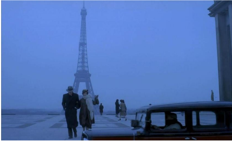
Görsel 15. Filmden Paris sahne örneği.

Filmde mekân, fiziksel özelliklerinden bağımsız olarak ışık düzeni aracılığıyla yeniden kurulmaktadır. Roma sahnelerinde kullanılan sert ışık ve düşük renk doygunluğu, mekânı katı, kapalı ve baskılayıcı bir yapıya dönüştürmektedir. Geniş iç mekânlar dahi bu ışık düzeni sayesinde daralmış ve sıkışmış hissi vermektedir. Buna karşılık Paris sahnelerinde ışığın daha yaygın ve yumuşak kullanımı, mekânın daha geçirgen ve akışkan algılanmasını sağlamaktadır. Bu karşıtlık, mekânın yalnızca fiziksel değil; ideolojik bir yapı olduğunu ortaya koymaktadır (Görsel 15). Bu iki şehir arasındaki karşıtlık, yalnızca coğrafi değil; ideolojik, algısal ve psikolojik bir ayrımı temsil etmektedir. Roma düzen ve baskının mekânıyken, Paris çözülme ve belirsizliğin alanı olarak belirir.