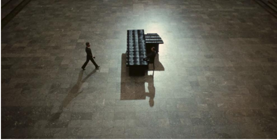
Görsel 12. Yüksek tavanlar, geniş ama boğucu iç mekân.

Görsel kafesin ideolojik niteliği, yalnızca ışığın mekânı çizgisel olarak bölmesiyle sınırlı değildir. Aynı zamanda mekânın genel geometrisi, kadralların simetrisi ve yüzeylerin sertliği de bu kafes yapısını destekler. Dönemin resmî bürokratik mekânları, uzun koridorlar, yüksek tavanlar, geniş ama boğucu iç mekânlar ve anıtsal mimari yüzeyler, öznenin bu düzen karşısındaki kırılma duygusunu sürekli yeniden üretir. Burada mekân, koruyan bir iç dünya değil; özneyi boyunduruk altına alan ve onu küçülten bir iktidar düzeni olarak çalışır. Işık bu mekânlarda çoğu zaman homojen değildir; belirli alanları vurgular, belirli alanları karartır ve karakteri özgürce yerleşebileceği bir bütünlükten mahrum bırakır. Sonuçta kadrallarda her unsur, iktidarın estetik organizasyonuna hizmet etmektedir (Görsel 12).