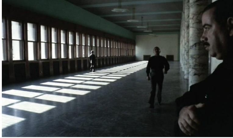
Görsel 8. Silüet ve Öznenin Kaybı – Koridor ve İç Mekân Geçişleri.

eden mimari çizgiler, kadraj içi düzenlemeler ve ışık-gölge ilişkileri, sahne içinde süreklilik duygusu yaratan ritmik bir yapı oluşturur (Brown, 2006, s. 39-40). Bu tekrar ve düzenleme desenleri, son derece sade görsel araçlarla kurulmuş olsa bile, sahnenin bütünlüğünü sağlayan ve izleyici algısını yönlendiren temel bir sinematografik ilke olarak işlev görmektedir. Böylece ritim, yalnızca zamansal bir akış değil, aynı zamanda ideolojik olarak kuşatılmış öznenin görsel düzlemde yeniden üretildiği bir yapı hâline gelmektedir.