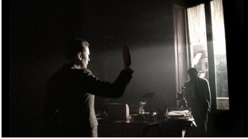
Görsel 1. Platon'un mağara alegorisine örnek sahne ekran görüntüsü filmin 56 ve 57. dakikaları.