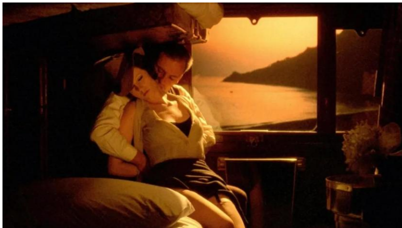
Görsel 4. Geçmişe dair sahneler altın tonlarında renk kullanımı.

Sinematografik ontoloji tartışması açısından bir diğer önemli boyut, ışığın zamansallıkla kurduğu ilişkidir. Sinemada ışık yalnızca mekânı değil, zamanı da kodlamaktadır. Sabah, akşam, gece, sis, yapay ışık, doğal ışık, titrek ya da sabit ışık, anlatının zamansal hissini belirlerken aynı zamanda karakterin ruhsal durumunu da işaret eder. The Conformist 'te bu zamansallık özellikle geçmişe dair sahnelerde, anıların amber ve altın tonlarla örülmesinde (Görsel 4); travmatik anların ise çoğu zaman sert kontrastlar ya da boğucu beyazlıklarla verilmesinde belirginleşir (Görsel 5). Böylece ışık, yalnızca mekânsal görünürlük değil, belleğin estetik düzeni olarak da çalışır. Geçmiş, nötr bir zaman katmanı olarak değil; renk, gölge ve ışık üzerinden biçimlenen duygusal bir topografya olarak geri çağırılır. Bu da sinema ontolojisinin yalnızca uzamsal değil, zamansal olarak da ışık tarafından kurulduğunu göstermektedir.