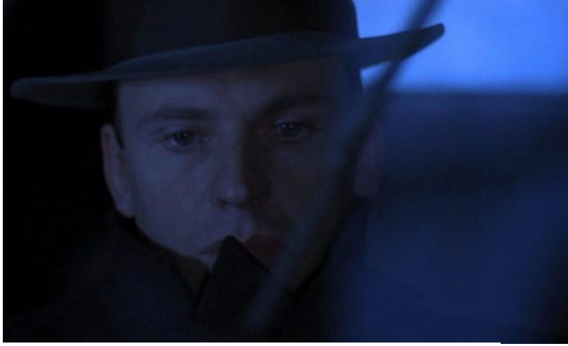
Görsel 5. Geçmişe dair sahneler sert kontrast renk kullanımı.

Ayrıca sinematografik ontoloji bakımından kadrajın içindeki her ışık kararı, aynı zamanda epistemolojik bir tercihtir. Çünkü ışık, izleyicinin neyi ne ölçüde bileceğini ve nasıl algılayacağını düzenler. Aşırı aydınlatılmış bir yüzey ile yarı karanlık bir yüzey aynı bilgi rejimine ait değildir. Benzer biçimde silüet olarak sunulan bir karakter, ayrıntıları görünür kılınmış bir karaktere göre çok daha farklı bir ontolojik statü taşımaktadır. Silüet, bireyin özsel derinliğinin yokluğunu, gizemini ya da içinin boşaltılmışlığını imler. The Conformist 'te Marcello'nun belirli anlarda silüete indirgenmesi, onun ahlaki merkezden ve sabit bir özne konumundan yoksun oluşunu görselleştirir. Bu tercih, karakteri yalnızca dramatik olarak değil, varoluşsal olarak da problematize eder. Marcello artık bir bireyden çok, ideoloji tarafından üretilmiş bir yüzey, bir kontur, bir gölge-varlık hâline gelmektedir.