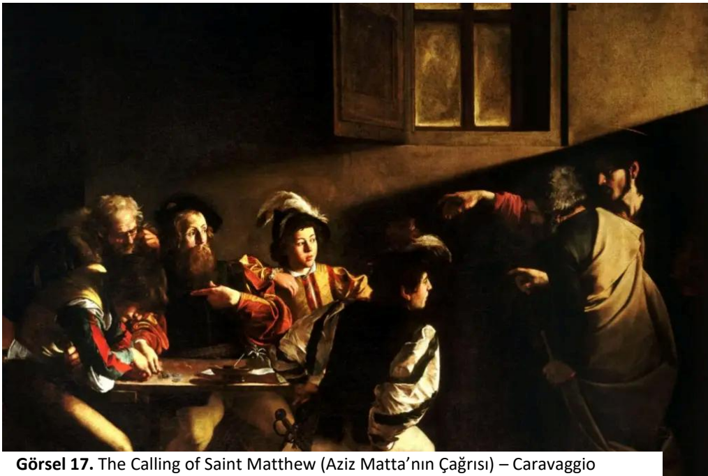
Görsel 17. The Calling of Saint Matthew (Aziz Matta'nın Çağrısı) – Caravaggio

The Conformist, görsel yapısı itibarıyla yalnızca modern sinemanın değil, aynı zamanda Barok resim geleneğinin de devamı olarak okunabilecek bir estetik düzlem üretmektedir. Bu bağlamda film, özellikle Caravaggio'nun geliştirdiği chiaroscuro tekniğinin sinematografik bir yeniden yorumunu sunar. Caravaggio'nun resimlerinde ışık, ilahi bir aydınlanmanın saf taşıyıcısı olmaktan ziyade, dramatik seçme ve dışlama süreçleriyle işleyen bir anlam kurucu olarak belirir. Figürler çoğu zaman karanlık bir boşluk içinden ani bir ışık müdahalesiyle görünür hâle gelir; ancak bu görünürlük hiçbir zaman tam değildir (Görsel 17). Benzer biçimde The Conformist'te ışık, nesnelere ya da karakterleri bütünüyle açığa çıkarmaz; aksine onları parçalayarak, bölerek ve belirli yönlerini vurgulayıp diğerlerini karanlıkta bırakarak kurar. Bu durum, sinematografik görüntünün ontolojik olarak eksik, parçalı ve seçilmiş bir gerçeklik olduğunu ortaya koyar.