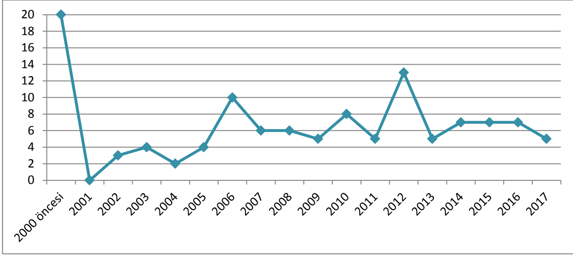
Şekil 3: Doktora Tezlerinin Yıllara Göre Dağılımı

2000 yılından sonra tezlerin tamamlandığı yıllara göre dağılımına baktığımızda en çok tezin tamamlandığı yıl 13 tez ile 2012'dir. 2012'yi takiben 2006'da 10 tez tamamlanmıştır. 2010 yılında 8 tez tamamlanmıştır. 2014, 2015 ve 2016 yıllarında ise 7 tez tamamlanmıştır. 6'şar tez de 2007 ve 2008 yıllarında tamamlanmıştır. 2009, 2011, 2013 ve 2017 yıllarında ise 5'er tez ile tamamlanmıştır. 2003 ve 2005 yıllarında da 4'er tez çalışması yapılmıştır. 2002 yılında 3 ve en az tezin tamamlandığı yıl olan 2004 yılında da 2 tez çalışması tamamlanmıştır. Grafikteki dağılıma baktığımızda yıllar arası geçişlerde sürekli bir artış veya azalış olmayıp sürekli bir dalgalanma olduğu gözlenmektedir. Ancak son dört yıl içerisinde tamamlanan tez oranı istikrarlı olarak devam etmektedir.