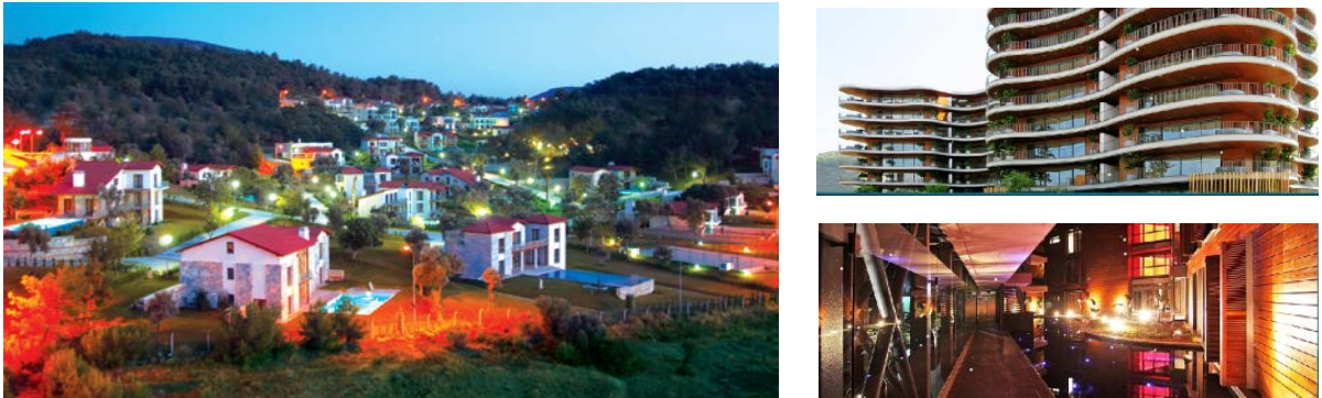
Resim 3. İzmir'de büyük ölçekli firmalar tarafından üretilen kapalı konut sitelerinden görünümler (Olive Park/Folkart Narlıdere)