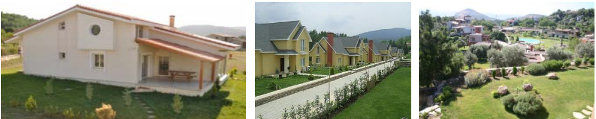
Resim 4. İzmir'de küçük ölçekli firmalar tarafından üretilen kapalı konut sitelerinden görünümler (Doğa Park/Park Koza/Egeli Evleri)