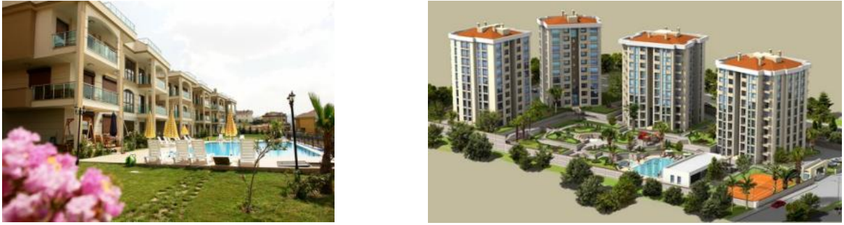
Resim 2. İstanbul'da küçük ölçekli firmalar tarafından üretilen kapalı konut sitelerinden görünümler (Beyaz Lale Villaları/Alize Park)