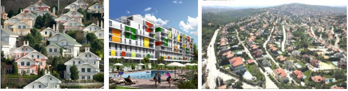
Resim 1. İstanbul'da büyük ölçekli firmalar tarafından üretilen kapalı konut sitelerinden görünümler (Beykoz Konakları/Narcity/Acarkent)