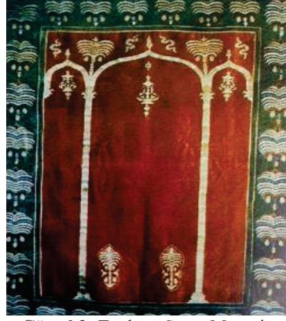
Görsel 3: Topkapı Saray Müzesi, Osmanlı Seccadesi (Barışta, 1999, 42).