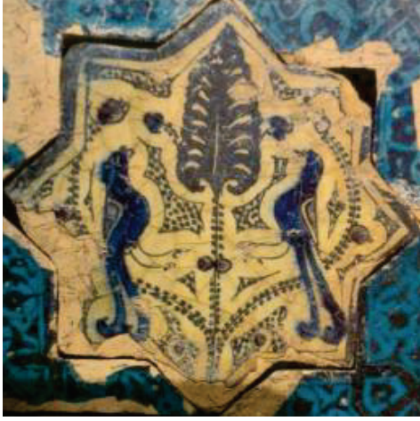
Görsel 2: Selçuklu Çinisi (Arık, 2000, 93).