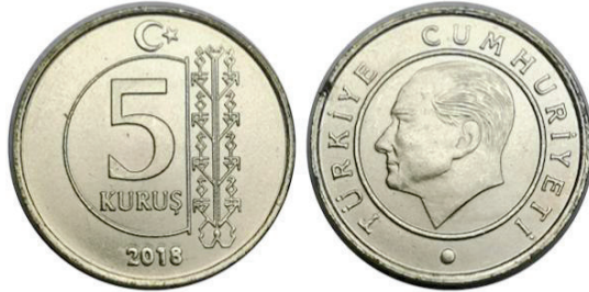
Görsel 4: Türkiye Cumhuriyeti 2018 Yılı 5 Kuruş (Ur12).

Yukarıda yapılan analizler sonucunda aşağıdaki tabloda, ağaç-kartal-yılan mitolojik örüntünün Türk kozmolojisi ve anlatı geleneği içindeki sembolik anlamları, kozmolojik konumları, işlevleri, Türk mitolojisindeki karşılıkları ve anlatılardaki rolleri özetlenmiştir. Bu üç unsur, birbirinden bağımsız değil, bütüncül bir yapı içinde anlam kazanmaktadır. Ağaç (kozmos/düzen)