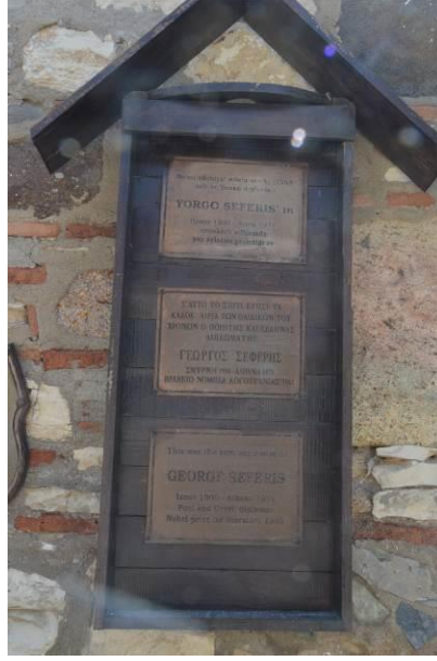
Şekil 12: Nobel ödüllü şair, Urla doğumlu Yorgo Seferis'in çocukluğunun geçtiği evdeki anı plaketi (Fotoğraf, Alpay Tırıl tarafından 26 Temmuz 2017 tarihinde çekilmiştir).

Yukarıdaki örnekler, önerilecek isimler ve mekânlar çoğaltılabilir. Ayrıca edebiyatın uzantısı olan sinema ve televizyon dizileri de edebiyat turizmini destekleyen unsurlar olarak ele alınabilir. “Asmalı Konak” dizisinin yayınlanmasından sonra Kapadokya’ya, “Parmaklıklar Ardında” dizisinin yayınlanmasından sonra Sinop’a gösterilen ilgi gözlerden kaçmamaktadır.