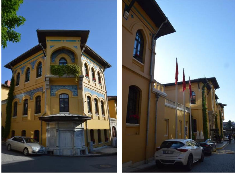
Şekil 11: Türk Edebiyatı'nın bir diğer önemli bellek mekânı Sultanahmet Cezaevi günümüzde otel olarak hizmet vermektedir (Fotoğraflar, Alpay Tırıl tarafından 13 Mayıs 2018 tarihinde çekilmiştir).

Türkiye’de edebiyat turizmine konu olabilecek mekânlar, yaşamlarının belli bir dönemini Türkiye’de geçirmiş ve/veya Türkiye’yi yazmış yabancı edebiyatçılar üzerinden, özellikle bu kalemlerin ülkelerine yönelik turizm hareketliliği sağlamak amacıyla genişletilebilir. Bu bağlamda verilebilecek birkaç örnek arasında, Nobel ödüllü Şair Yorgo Seferis’in doğum yeri olan Urla (Şekil 12), ünlü Fransız yazarlar Pierre Loti ve Alphonse de Lamartine’nin Türkiye’deki yaşamları ve eserlerinin izlerinin sürülmesi, “İstanbul” adlı bir kitabı bulunan ünlü İtalyan yazar Edmondo de Amicis’in İstanbul’unun keşfi, Agatha Christie’nin polisiye öyküsü “Doğu Ekspresinde Cinayet” eşliğinde yazarın İstanbul günlerinin aranması, yaşamını bir sürgün olarak İstanbul’da tamamlayan ve burada yaşadığı ev Polonya Hükümeti’nin girişimleriyle müze haline getirilen, Polonya’nın en önemli şairlerinden Adam Mickiewicz anılabilir. Bu örnekler; başka yazarlar, gezginler, onların Türkiye’deki yaşamları, yazıları, anıları, mektupları vb ile zenginleştirilebilir.