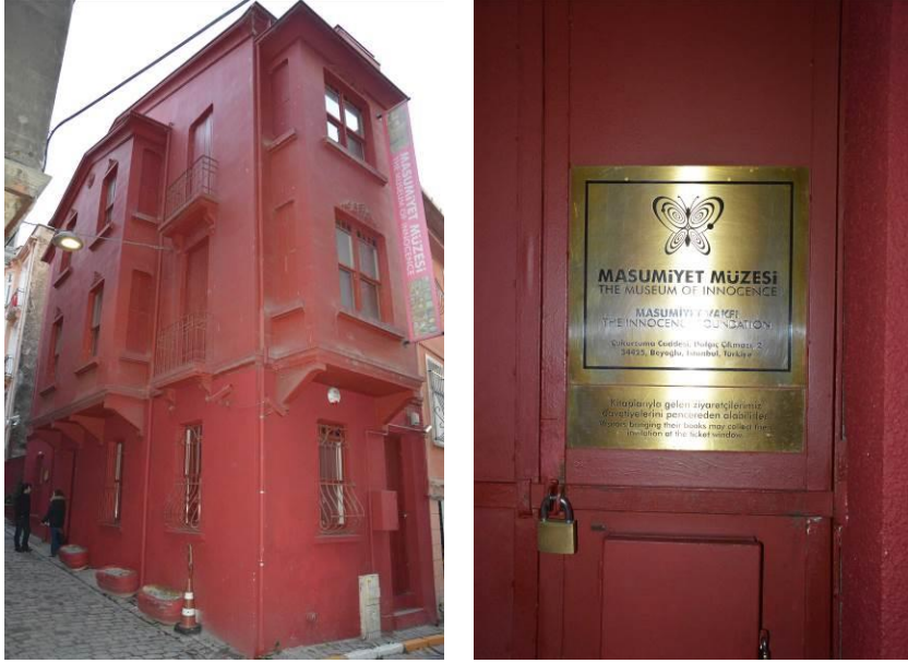
Şekil 7: İstanbul’da “Masumiyet Müzesi”, aynı adlı romanın müzesi olarak yazarı tarafından düzenlenmiştir (Fotoğraflar, Alpay Tırıl tarafından 11 Ocak 2016 tarihinde çekilmiştir).

Yukarıda başlıca örnekleri verilen, restore edilerek müze, kültür evi, anı evi vb. adlarla edebiyatçıların anılarını yaşatan evler kadar şanslı olmayan edebiyatçı evleri kat kat fazladır. Örneğin, Ahmet Muhip Dıranas tarafından, Sinop-Erfelek’te bir dağ köyü olan Karaoğlu’nda, ormanın kenarında yaptırılmış, iki katlı, ahşap bir dağ evi çürümektedir (Şekil 8). Dıranas’ın lirizmin doruklarında dolaşan şiiirleri, ulu kestane ve kayınların arasından geçen dağ yollarından ulaşılan bu evin kayınlı ve göknarlı bahçesinde yakılmış bir kamp ateşinin çevresinde serin bir yaz akşamı okunması ve Sinop ve çevresindeki doğa ve kültür turlarıyla entegre edilmiş böyle bir turun düzenlenmesi sağlanabilir.