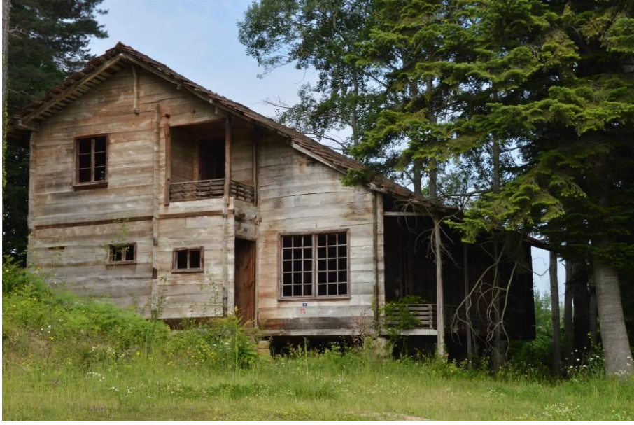
Şekil 8: Ahmet Muhip Dıranas'ın babasının köyünde yaptırdığı ev (Fotoğraf, Alpak Tırıl tarafından 2 Haziran 2017 tarihinde çekilmiştir).

Ahmet Hamdi Tanpınar, Bedri Rahmi Eyüboğlu gibi edebiyatçıların yaşadığı Beyoğlu'ndaki Narmanlı Han, yine Ahmet Hamdi Tanpınar ve Orhan Veli'nin yaşadığı Ankara'daki Vakıf Apartmanı ve başta İstanbul olmak üzere değişik kentlerde henüz tamamen tahrip olmamış edebiyatçı evleri de “kültür ve anı evi” olarak edebiyatseverlerle buluşabilecekleri günleri beklemektedirler.