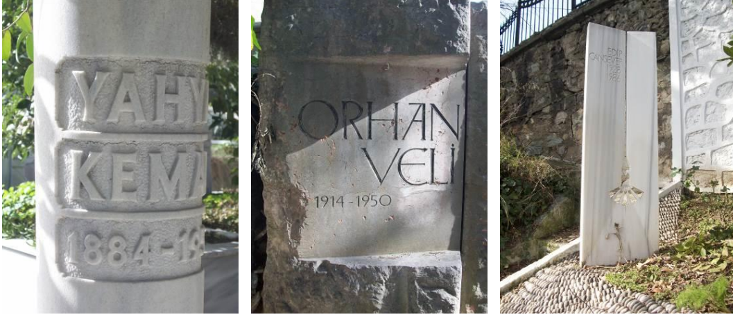
Şekil 9: İstanbul'dan bazı edebiyatçı mezarları.

nın olması da, gazeteci olan dedesinin Sinop'un zorunlu konuklarından olmasındandır.