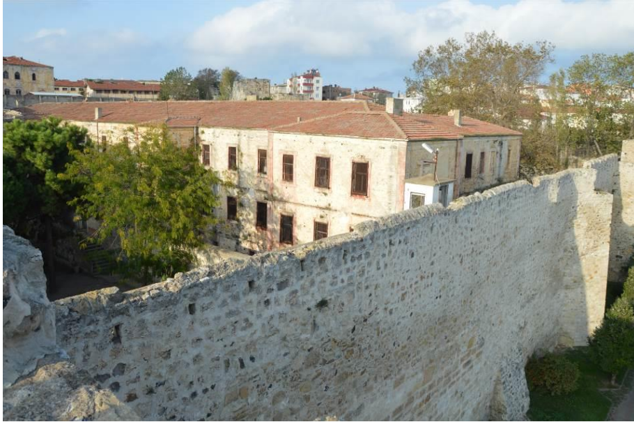
Şekil 10: Türk Edebiyatı'nın önemli bellek mekânlarından Sinop Tarihi Cezaevi (Fotoğraf, Alpay Tırıl tarafından 20 Ekim 2015 tarihinde çekilmiştir).

Sinop Cezaevi yanında, restore edilerek otel yapılan Sultanahmet Cezaevi de önemli bir edebiyat belleğidir (Şekil 11). Ömrünün bir bölümü, Sultanahmet, Bursa ve Çankırı Hapishanelerinde geçen Nazım Hikmet edebiyatında bu hapishanelerin yeri yadsınamaz.