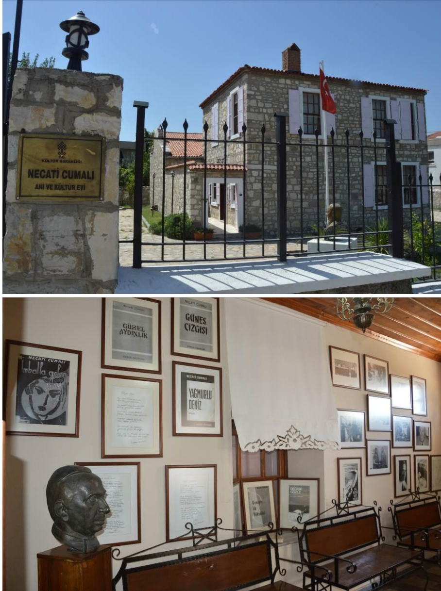
Şekil 5: Necati Cumalı Anı ve Kültür Evi'nin dıştan ve içten görünümü (Fotoğraflar, Alpay Tırıl tarafından 26 Temmuz 2017 tarihinde çekilmiştir).

Kültür Bakanlığı'nın katkılarıyla 2001'de kültür ve anı evi olarak açılmıştır (Şekil 5).