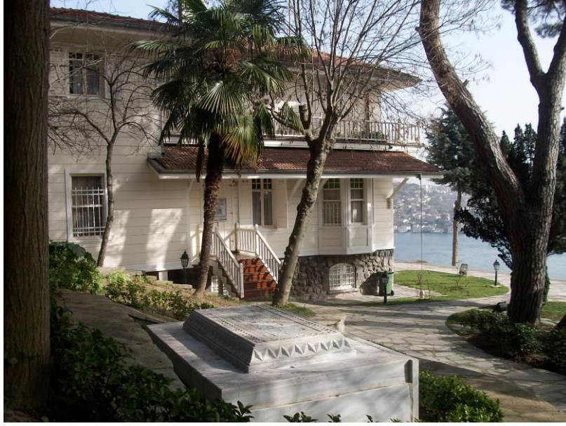
Şekil 4: Tefvik Fikret'in evi ve mezarı (Fotoğraf, Alpay Tırıl tarafından 23 Ocak 2015 tarihinde çekilmiştir).