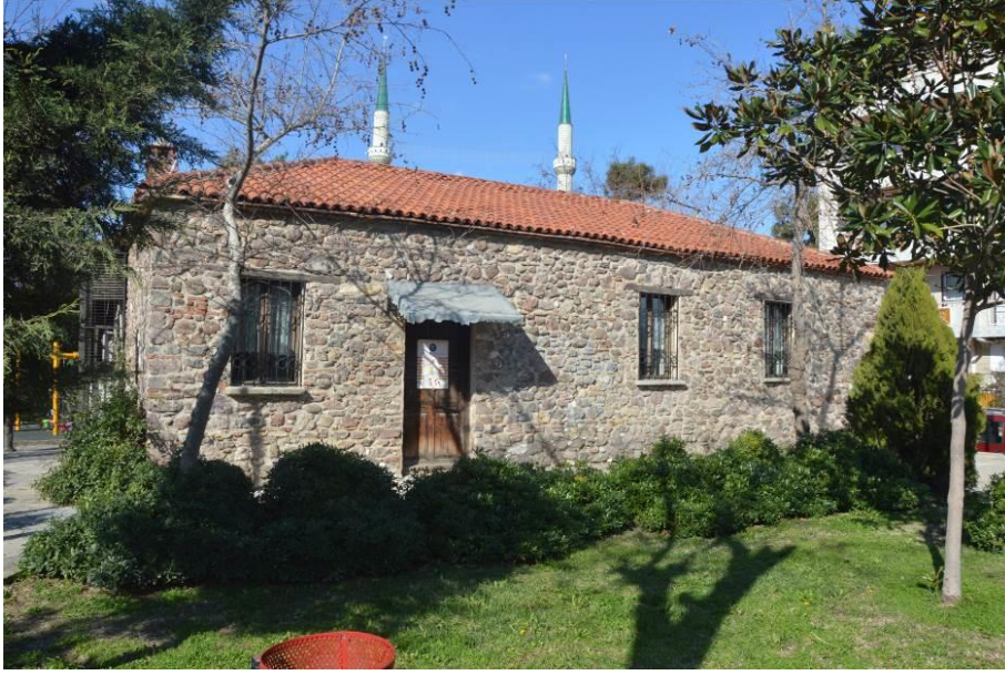
Şekil 6: Reşat Nuri Güntekin'in bir dönem kullandığı bağ evi, günümüzde çocuk kütüphanesi olarak kullanılmaktadır.