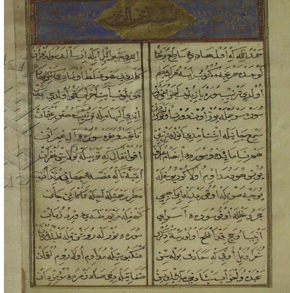
Süleymaniye Kütüphanesi İbrahim Efendi Bölümü Nüshası