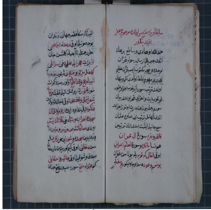
Kütahya Vahidpaşa İl Halk Kütüphanesi Nüshası