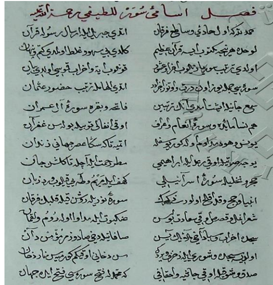
Süleymaniye Kütüphanesi Şehit Ali Paşa Bölümü Nüshası