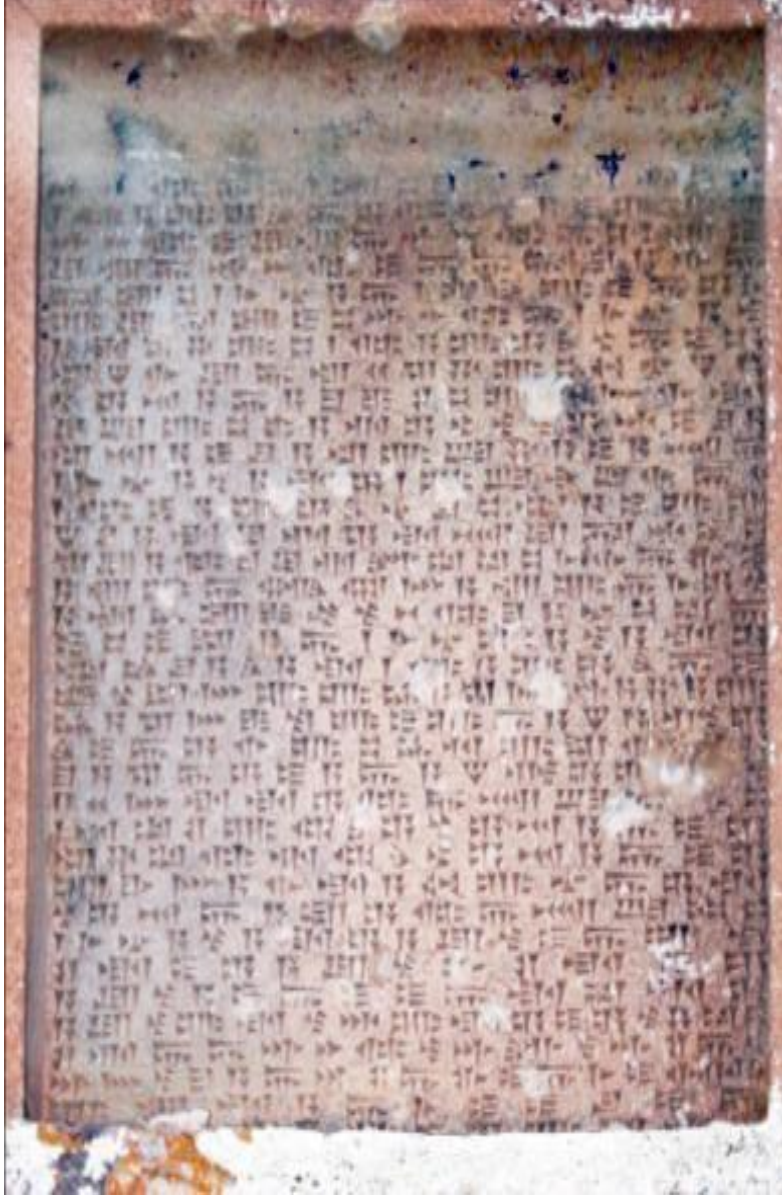
Foto -2- Yazılıta Yazıtı