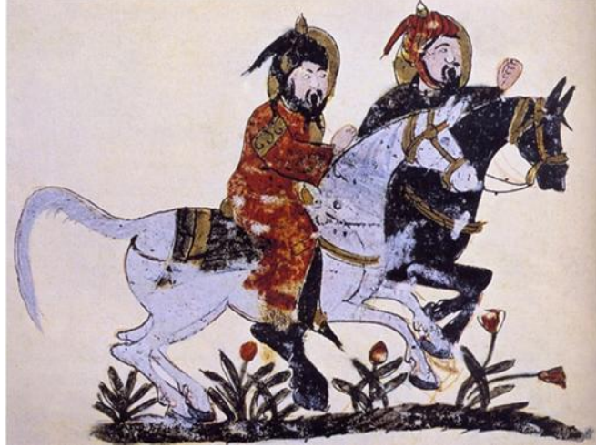
Resim 3. Atlılar, Ahmed ibn el- Hüseyin ibn el-Ahnaf, Kitab el-Baytara, kâğıt üzerine opak pigmentli boya, Topkapı Sarayı Müzesi, III Ahmed Kitaplığı, 2115, İstanbul.