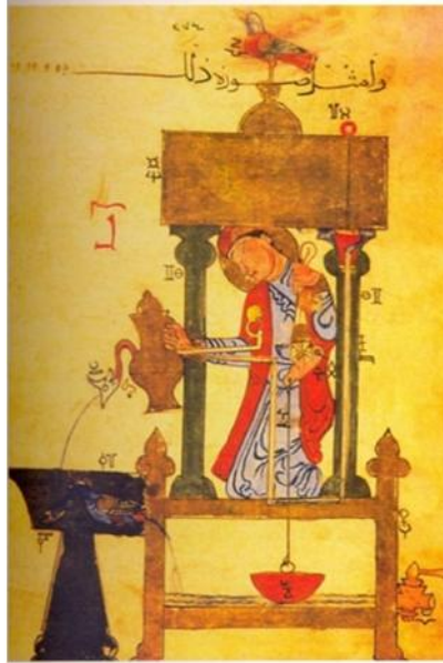
Resim 6. Elinde ibri i ile insan görünümlü bir tasarım, el-Cezeri, Kitâb fî Ma'rîfet el-Hiyel el-Hendesiyye , Nisan 1206 Diyarbakır, Topkapı Sarayı Müzesi III.Ahmet Kitaplı 1, 3472 s.139b.