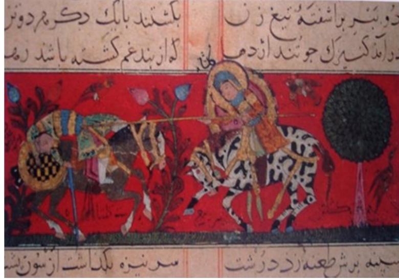
Resim 7. Gül ah'ın Adenli sava çıyı öldürmesi: Varka ve Gül ah , Selçuklu dönemi, Konya, 13. yy., [TSMK, H. 841, y. 23 b].