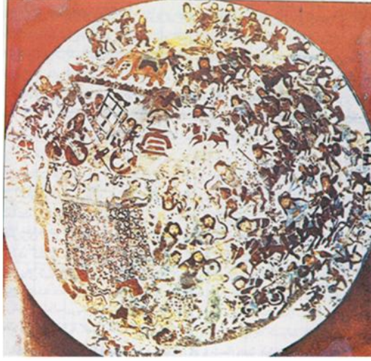
Resim 5. Minaî Seramik Tabak Yüzündeki Sava Sahnesi: Büyük Selçuklu dönemi, [Washington Freer Gallery of Art, 43.3].