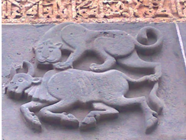
Resim 8. Bo aya Saldıran Aslan, Selçuklu Dönemi Duvar Kabartması, Diyarbakır , Ulucami.