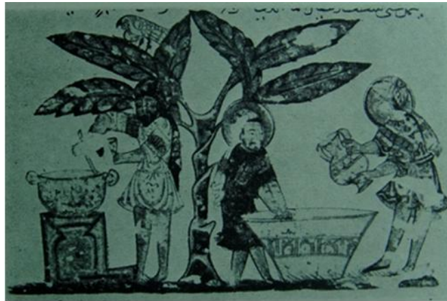
Resim 2. laç Hazırlanması, Kitâbü'l-Ha âyi , Ba dat, 1222 ( H. 619).