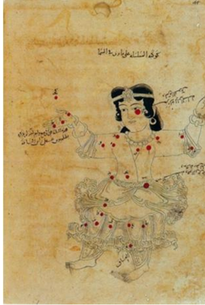
Resim 4. Andromeda (Zincirli Kız) Galaksisi çizimi, Suvar el Kavakı es Sabita, 984 yılı (Bodleian Library)