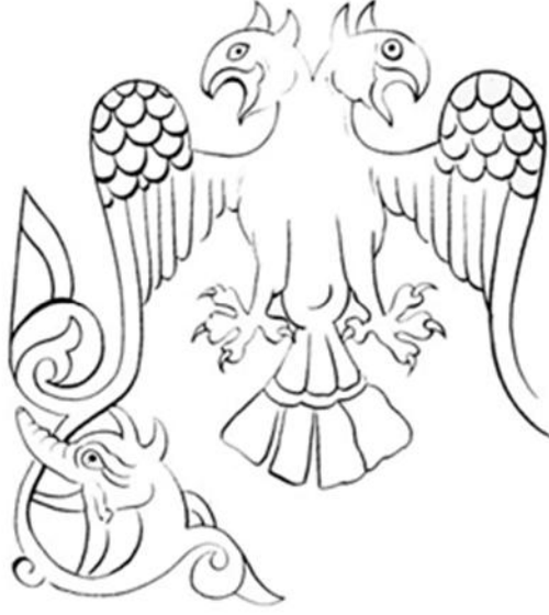
Resim 9: pek kuma üstüne altın simle i lenmi çift ba lı kartal, 13. yy. Konya (Berlin Staatliche Museum).