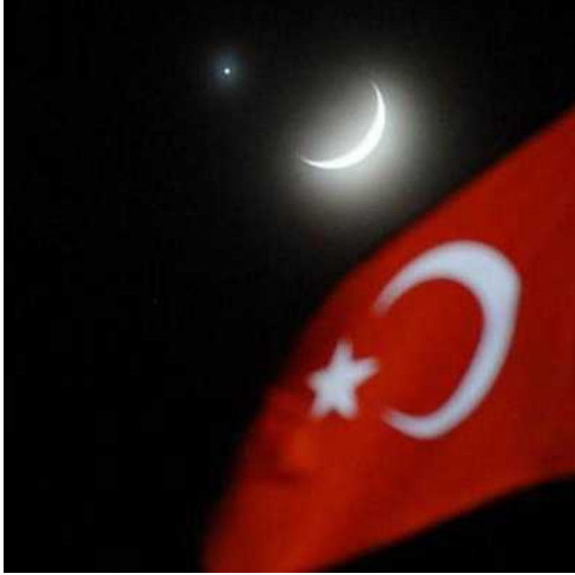
Yıldızın Bayra ımız Üzerindeki Yeri

25 Aralık 1793 tarihinde de bu sefer al bayra ımıza be kö eli yıldız ilave edilir 8 .