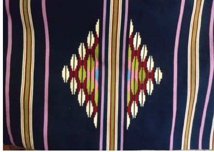
Resim 1. Geometrik desenli bir Antakya kilimi