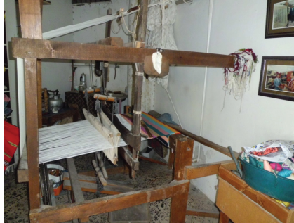
Resim 2. 110 yıllık Antakya kilim tezgahı