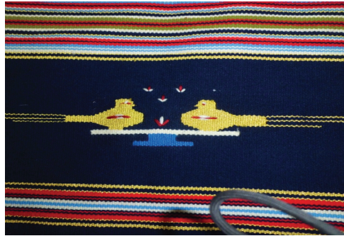
Resim 8. Kuş motifli Antakya kilimi

(Bu motifi dokuma ustası Çavuş motifi diye adlandırmıştır.)