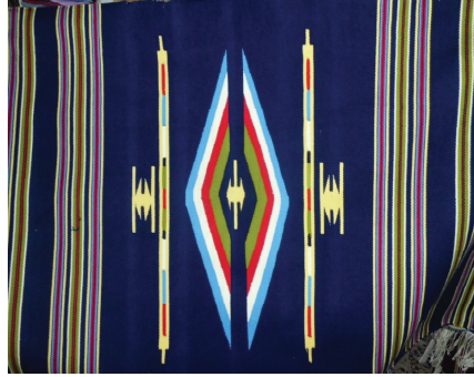
Resim 7. Karışık motifli Antakya kilimi

(Bu motifi dokuma ustası Çavuş motifi diye adlandırmıştır.)