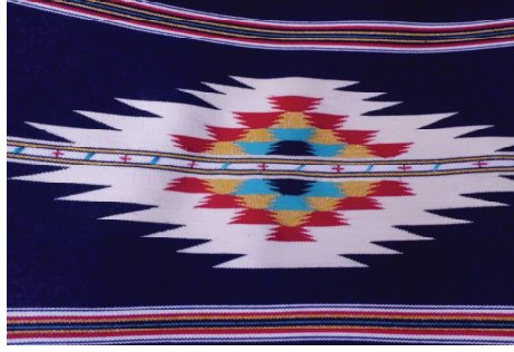
Resim 9. Pıtrak motifli Antakya kilimi