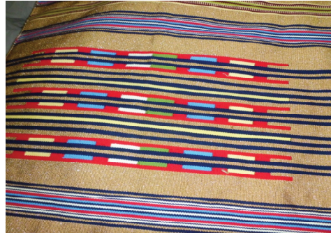
Resim 11. Antakya kilimlerinde kullanılan renkler