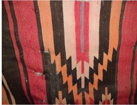
Resim 5. 70 yıllık bir Antakya kilimi (Reyhanlı Modeli)