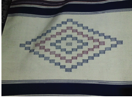
Resim 6. Mozaik motifli Antakya kilimi.