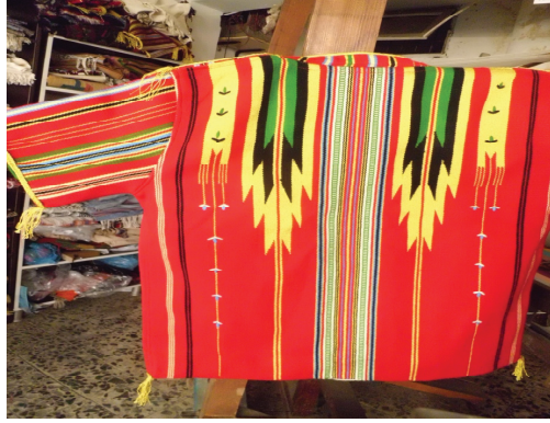
Resim 3. Reyhanlı Modeli İşlenmiş Antakya Aba Örneği