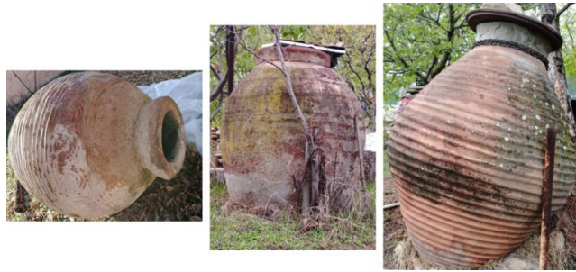
Resim 14. Yazıköy, Selim Karakaş Evi’nin Bahçesindeki Sirke ve Şarap Küpleri

100 cm’den küçük pişmiş toprak küpler çoğunlukta olmakla birlikte 100-150 cm’den büyük pithosların da fermantasyon işlemlerinin yanında sirke ve şarap olgunlaştırmada kullanıldıkları belirlenmiştir. Form özellikleri açısından incelendiğinde Yazıköy’deki pişmiş toprak küpler, yumurta ve ters armut şekilli olarak iki ayrı grupta değerlendirilebilir. Cidar kalınlıkları 2-4 cm arasında değişen küplerin gövde ve omuz bölümlerinde çoğunlukla kabartma teknikli süslemeler yer aldığı gibi sade bir görünüme sahip uygulamalar da mevcuttur.