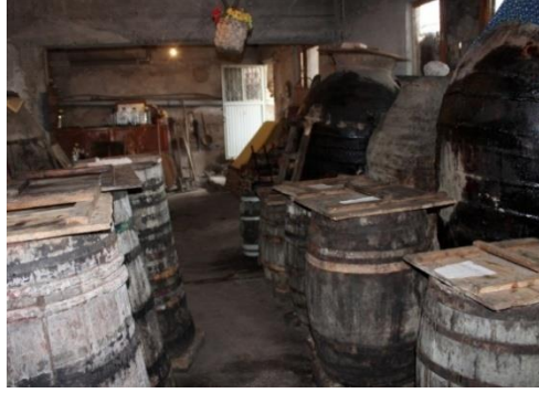
Resim 13. Yazıköy, Ahmet Karakulluk Evi’ndeki Küpler ve Fıçılar