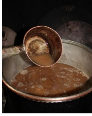
Resim 15. Yazıköy, Geleneksel Yöntemlerle Pekmez Yapımı

Geleneksel üretim düzeneğinde, ezme havuzu ile şıra toplama ünitesi arasında filtrasyon görevini üstlenen tahliye kanalı, poterum adı verilen sızdırmaz bir tıpa vasıtasıyla kontrol altında tutulmaktadır. Üretim sürecinde, havuz içerisinde biriken üzüm suyu arzu edilen seviyeye ulaştığında, poterum mekanizması açılarak şıranın kontrollü bir biçimde toplama haznesine akışı sağlanır. Birinci aşama sonrasında havuzda kalan üzüm posaları, vidalı pres sistemleri ya da mekanik basınç kollarının kullanıldığı sıkıştırma yöntemleriyle son suyuna kadar işlenmektedir; alternatif olarak posaların torbalara aktarılıp basınç uygulanması suretiyle ekstraksiyon işlemi tamamlanmaktadır (Diler, 1995: 83-84; Karakaya, 2008: 35; Türker ve Gür, 2024: 746).