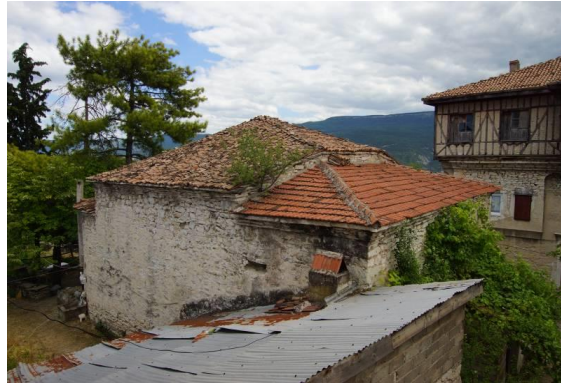
Resim 4. Yazıköy Kilisesi (Başmelek Mikhail Kilisesi), Kuzeybatıdan Görünüm

Yazıköy merkezde, Çoban Mahallesi'nde numara 3'te yer alan Yazıköy Kilisesi (Başmelek Mikhail Kilisesi) 32 yıldır Mescidi Sani adıyla Müslümanlar tarafından dini yapı olarak kullanılmaktadır Doğu-batı doğrultusunda dikdörtgen planlı kilise tek neflidir. Kilise, ortada kareye yakın dikdörtgen naos, naosun batısında kuzey-güney doğrultusunda bir narteks, naosun doğusunda ise iki apsisten ibarettir. Kilise içten 9.60 x 13.90 m, dıştan ise 11.80 x 16.20 m ölçülerindedir (Soykan ve Gür, 2019: 51, Çizim 11, Resim 26-28). Naosun üzerinde kubbe yer alır. Kilisenin üzeri dört yönde kırma çatılı ve kiremit kaplıdır. Güney cephenin batısında, kapının üzerindeki kalem işi teknikli kitabe 1853 tarihlidir (Resim 4-5).