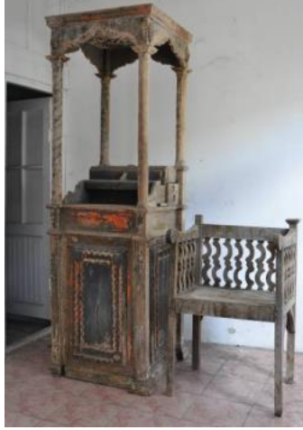
Resim 6. Yazıköy Kilisesi'ne (Başmelek Mikhail Kilisesi) Ait Proskynetarion ve Koltuk

Nüfus Mübadelesi ile birlikte Yazıköylü Rumlar kiliselerinden taşınabilir nitelikteki bazı eşyalarını yanlarında Yunanistan'a götürmüş bazılarını ise geri döneriz düşüncesiyle arkalarında bırakmıştır (Kuş ve Ulukavak, 2015: 307). Geride bıraktıkları eşyalar kısa sürede tarihin tozlu sayfalarına karışmış ya da tahrip olmuştur. Yazıköy'ün eski muhtarı (rahmetli) Ahmet Büyüközdemir ve muhtarlığın azaları tarafından bazı eserler koruma altına alınmıştır. Bunlardan günümüze ulaşabilmiş sınırlı miras eserleri arasında ise bir tane proskynetarion (ikona sehpası), ahşap bir koltuk ve metal bir anahtar (proskynetarionun anahtarı) yer almaktadır. Bu eserler ise günümüzde Yazıköy Muhtarlığı'nın yedieminler deposunda korunmaktadır (Resim 6).