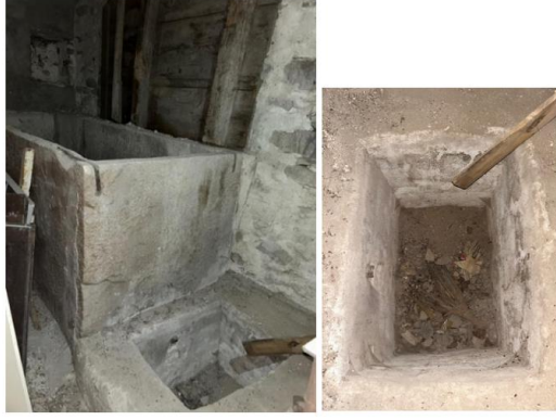
Resim 12. Yazıköy, Ahmet Muslu Evi’ndeki İşlik