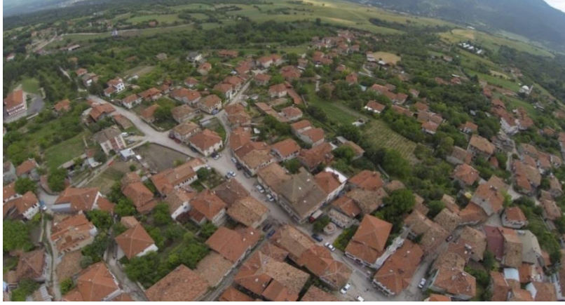
Resim 1. Yazıköy, Havadan Görünüm