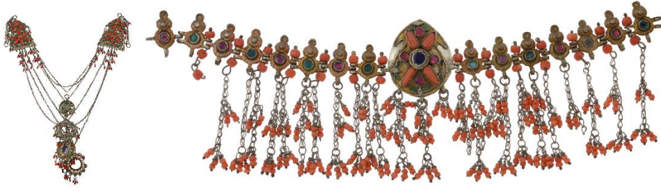
Resim 2 a-b. Safranbolulu Kadınlar Tarafından Kullanılmış Gümüş ve Değerli Taşlara Sahip Takılar