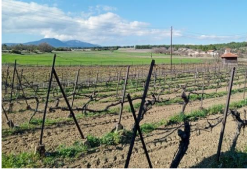
Resim 9. Yazıköy'deki Bağlar ve Bağ Evleri

Safranbolu ve Yazıköy'ün kışlık yerleşiminin aksine Bağlar, halkın yaz aylarını geçirdiği, doğayla iç içe bir üretim alanıdır. Şehrin bu iki merkezli yapısı, Safranbolu insanının yaşam ritmini belirler. Haziran ayının gelişiyile birlikte aileler, yanlarına kışlık üretim için gerekli araç-gereçlerini de alarak bağ evlerine taşınırlar. Bu taşınma süreci, mahalleler arasında bir hareketliliğe ve sosyal bir canlılığa neden olur (Κυριακοπούλου, 1998: 44). Yazıköy çevresinde hala günümüze ulaşabilmiş tek ve iki katlı bağ evlerinin yaygın olduğu görülmektedir (Özdemir, 2022: 67-70). Bağlar bölgesinde, bölgenin iklimine uyum sağlamış çok çeşitli üzüm türleri yetiştirilir. Bunların bir kısmı sofralık (taze tüketim için), bir kısmı ise işlenmek (şarap ve sirke üretimi için) üzere özel olarak bakılır. Her Rum ailesinin mutlaka kendine ait bir bağı ve içinde küçük bir barınağı veya görkemli bir bağ evi bulunur. Bu bağlar, kuşaktan kuşağa aktarılan en değerli aile mirası olarak görülür. Bağların verimliliği, bölgedeki kaynak sularının (arklar) adaletli ve sistemli bir şekilde dağıtılmasına bağlıdır. Suyun kullanımı üzerine kurulu eski gelenekler, komşuluk ilişkilerinin de temelini oluşturur (Κυριακοπούλου, 1998: 44).