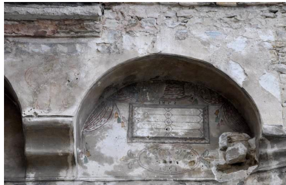
Resim 5. Yazıköy Kilisesi (Başmelek Mikhail Kilisesi), Kitabe