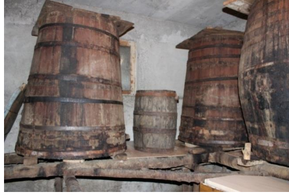
Resim 8. Yazıköy, Ahmet Karakulluk Evi'ndeki Meşe Fıçılar