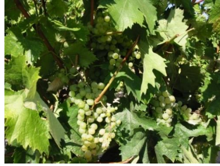
Resim 10. Yazıköy'deki Bağlarda Yetiştirilen Çiftlik Üzümü