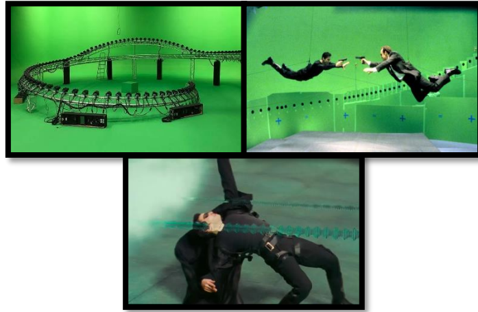
Görsel 4: Neo'nun silah ateşinden kaçtığı The Matrix (Wachowski, 1999) filmindeki sahne

Bullet Time, hareketi belirgin şekilde yavaşlatan ve bu askıya alınmış zaman diliminde kameranın uzamda serbestçe hareket etmesini sağlayan sinematografik bir yöntemdir. Sahne öncelikle geleneksel kameralarla çekilir ve kameranın hareket rotası bilgisayarlar aracılığıyla haritalandırılır. Kamera hareketinin güzergâhı boyunca, eylemi dairesel biçimde çevreleyecek şekilde 100'den fazla fotoğraf makinesi bir hat üzerinde konumlandırılır. Bu kameralar, daha sonra animasyon hâline getirilebilen bir dizi durağan görüntü kaydeder ve böylece yönetmenlere, kamera hareketinin hızını sahnede gerçekleşen olaya göre özgürce değiştirme imkânı sağlar. Dolayısıyla bullet-time sırasında, olay ağır çekimde gerçekleşirken kamera, eylemin etrafında daha yüksek bir hızla ve farklı bir yönde hareket ediyormuş gibi görünür (Purse, 2005, s. 162). Sinema tarihinde sıkça örnek gösterilen bu teknolojinin en dikkat çekici örneği, Neo'nun silah ateşinden kaçtığı The Matrix (Wachowski, 1999) filmindeki sahnedir. Bu sahnede, kamera karakterin etrafında üç boyutlu olarak hareket ederken zaman neredeyse tamamen durmuş gibi görünür ve böylece hem zamansal hem de mekansal algı aynı anda manipüle edilir (Görsel 4).