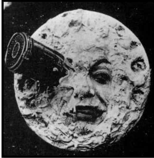
Görsel 3: A Trip to the Moon “Ay’a Seyahat” (1902)

Zamanın manipülasyonu olgusu, aynı zamanda felsefi düşüncede önemli karşılıklar bulmuştur. Henri Bergson'un “süre” (durée) kavramı, yalnızca geçmişten geleceğe uzanan