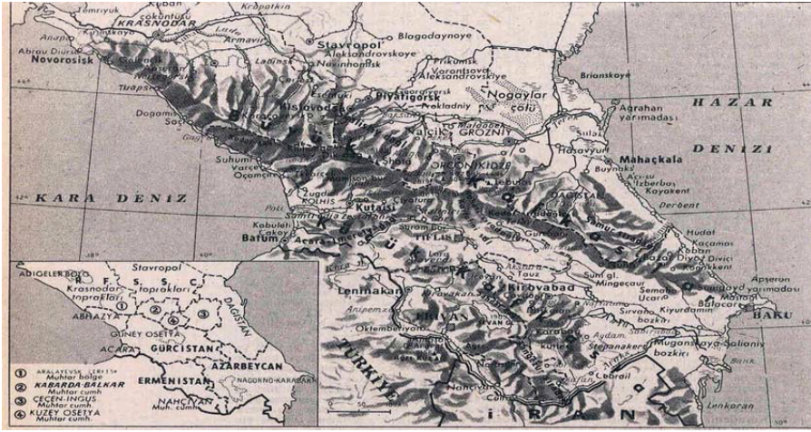
Harita 2: Kafkasya Bölgesi ve Kafkasya Dağları (Fiziki ve Siyasi) 15

Coğrafi yapıya gelince, Rus kıta sahanlığının kuzeye, Arap kıta sahanlığının da güneye kaymasıyla gerçekleşen jeofizik gerilim, Transkafkasya'daki dağlık yüzey şekillerini yaratmıştır. Kafkasya; Hazar Denizi ile Karadeniz arasında 440.000km 2 .lik bir alanı kaplayan, Rusya Federasyonu'nun Avrupa kesiminin güney batısı ile Gürcistan, Azerbaycan ve Ermenistan topraklarını da içine alan, coğrafi bölge ve dağ sistemine verilen isimdir. Jeolojik olarak incelendiğinde, Kafkasya, kuzeybatı-güneydoğu doğrultusunda uzanan, çöküntü alanları arasında yükselen dağ sıralarından oluşmaktadır. "Rusların, "Bolchoi Kavkaz" diye adlandırdıkları Büyük Kafkaslar, kuzeybatıda, Novorossisk'den güneydoğuda, Bakü'ye doğru yaklaşık 1100 km. uzunluğu ve 150-200 km.lik genişliğiyle, kuzey-güney doğrultulu sıradağlardan oluşur. "Malyi Kavkaz" denilen Küçük Kafkaslar, Büyük Kafkaslar'a göre daha kısa ancak daha karmaşıktır." 14