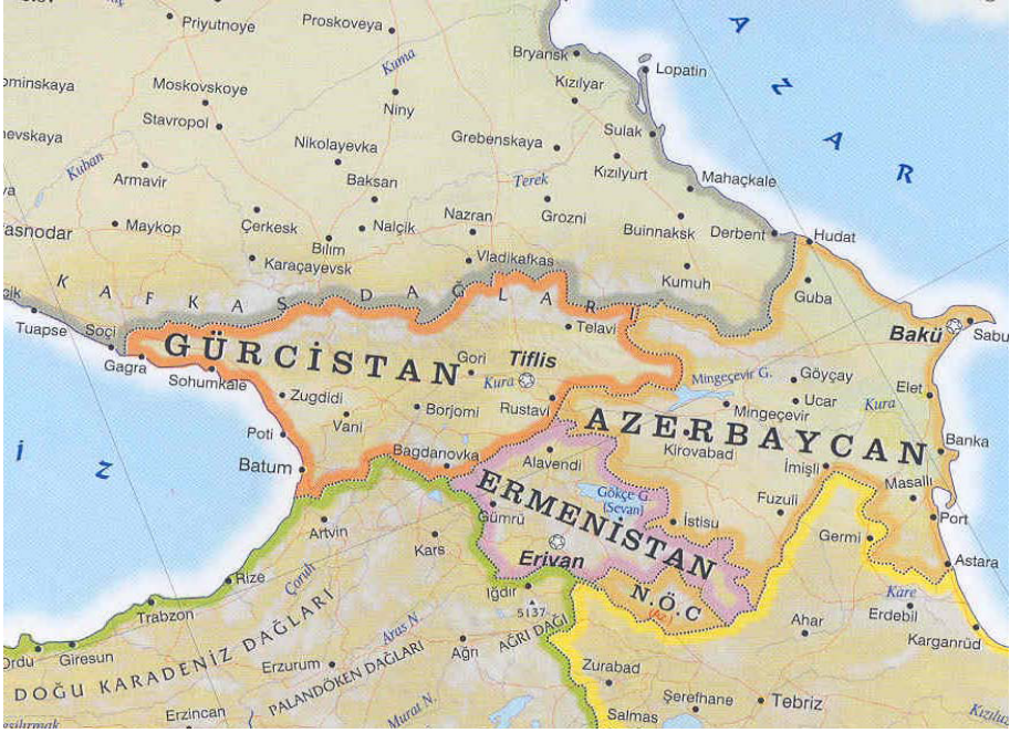
Avrupa Siyasi Haritası 16

Bu durumun bir göstergesi olarak tarih boyunca Avrupa'dan Asya'ya, Asya'dan Avrupa'ya göç eden veya askeri harekâta bulunan milletler, daima Kafkasya ile alakalı olmak mecburiyetinde kalmışlardır. Nitekim güneyde Medler, Farslar, Romalılar, Bizanslılar, Selçuklular ve Osmanlılar; kuzeyde ise Hunlar, Hazarlar, Moğollar ve son iki yüz yıldır Ruslar'ın takip ettiği siyaset aynı tarzda olmuştur. Mesela Ruslar, Kafkasya'yı işgal etmedikleri müddetçe doğuda ve batıda ciddi hareketlere girişmemişlerdir. 17 Ayrıca Kafkasya; Avrupa Rusya'sı ve Orta Asya ile Anadolu'yu ve Orta Doğu'yu bağlamakla birlikte; Doğu-Batı yönünde de Orta Asya'nın denizlere ulaşması mümkün en kısa ve uygun istikametteki yol üzerinde bulunmaktadır. Bu durum bölgeyi daima ticaret merkezi haline getirmiştir. Böylece eskiden beri ticari bir zenginliğe sahip olan Kafkasya birçok devletin hâkimiyetine almaya çalıştığı bir yer haline gelmiştir. 18