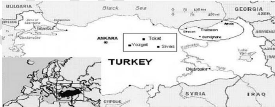
Şekil 2. Kırım-kongo kanamalı ateşi (Kkka) olan hastaların coğrafi dağılımı, Türkiye, 2002-2003. İnceleme altındaki Kkka enfeksiyonu olan hastaların ikametgahları daire-dikdörtgen içinde işaretlenmiştir (7).