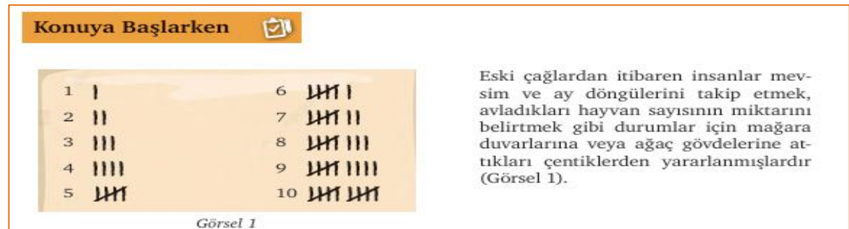
Şekil 2. Sayılar Teması, ‘Konuya Başlarken’ grubuna ait analiz birimi (9.Sınıf 1. Ders Kitabı)

Şekil 2 incelendiğinde kavram/ifade ile gerçek hayat ilişkisinin sözel olarak belirtilmesinin yer aldığı görülmektedir. Bu sebeple şekil 2’de gerçek hayattan sözel örnek verme alt kategorisine ait 1 veri hesaplanmıştır.