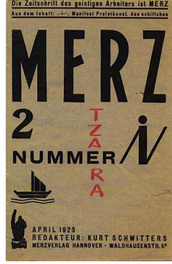
Şekil 8: Kurt Schwitters Merz dergisi 1923