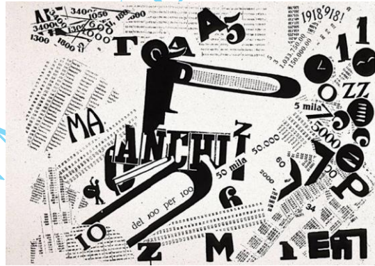
Şekil 1: Words and Freedom, Filippo Tommaso Marinetti, 1914.

Tipografi ve metin düzeni söz konusu olduğunda, bu iki akım arasında bazı benzerlikler ve farklılıklar bulunmaktadır: Fütürizm de İtalyan şair Filippo Tommaso Marinetti'nin Fütürist Manifestosu (1909) ile Yeni Tipografi ve Fütürizmin gelişimine dair önemli bir başlangıç olduğu görülmektedir. Böylece Marinetti özgür sözcüklerle geleneksel sayfa armonisini yıkarak yerine tipografide iki boyutluluğun sınırlarını zorlamıştır (Şekil 1). Sanatçı şiddet, tahrik edici ve devrimci propagandayı yansıtan; patlayan, çarpışan, zıplayan dinamik bir tipografi kullanmıştır (Becer, 2016, s. 49-59).