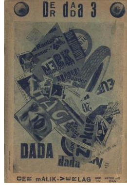
Şekil 11: Der Dada Dergisi Sayı 3, Berlin, Nisan 1920.