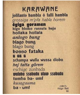
Şekil 5: Hugo Ball, Soyut sözcüklerle ses şiiri, 1917.