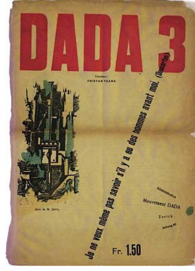
Şekil 7: Tristan Tzara, Zürih, Temmuz 1917.