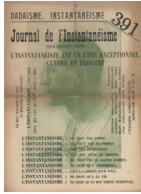
Şekil 10: 391'in 19. sayısının kapağı, Francis Picabia tarafından hazırlanmıştır 1924