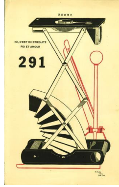
Şekil 9: 291, Francis Picabia, 5-6. sayısının kapağında Picabia'nın Stieglitz portresi, Portre, fotoğraf makinesi parçalarından oluşan bir makine deseni 1915

tasarımı sadece bir duyuru aracı olmaktan çıkarıp kendi başına bir kavramsal sanat nesnesine dönüştürmüştür.