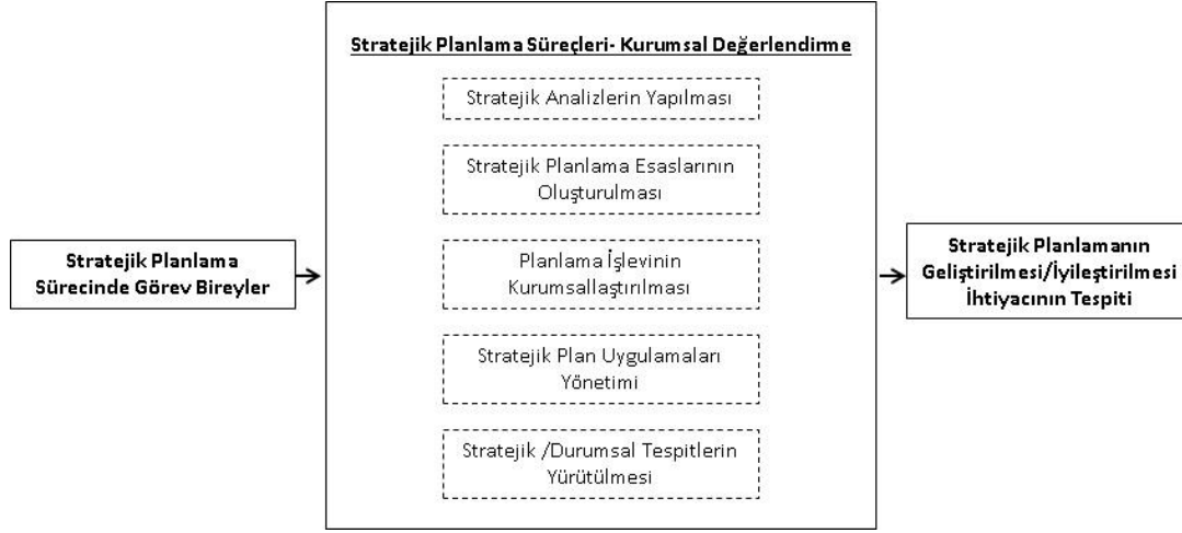
Şekil 2. Stratejik Planlama Süreci Kurumsal Değerlendirme - Kavramsal Çerçeve