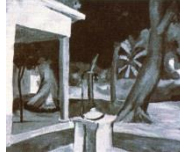
Görsel 9. Kuyulu Kahve