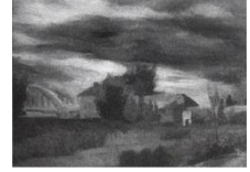
Görsel 11. Akköprü Ziraat İstasyonunda Fidanlı Bir Yol