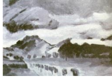
Görsel 4. Antalya Feneryolu