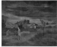
Görsel 12. Akköprü Ziraat İstasyonunda Köylüler