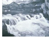
Görsel 5. Manavgat Şelale