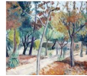
Görsel 13. Sonbahar