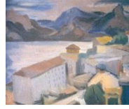
Görsel 8. Tophane Bahçesinde Akşam