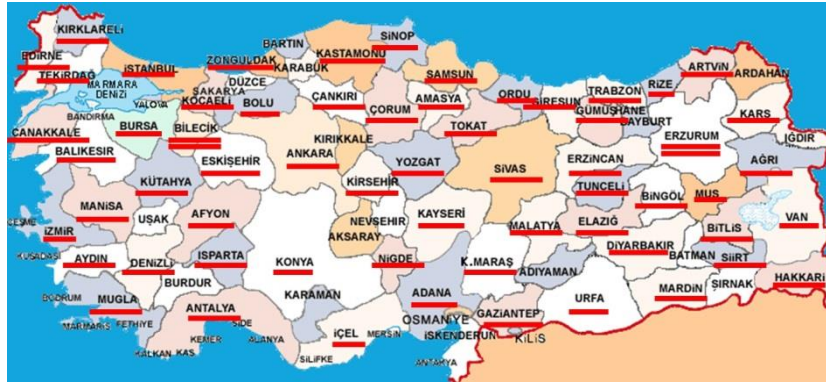
Görsel 1: Yurt Gezilerine Gönderilen Ressamların Gittikleri İller (1938-1943)