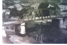
Görsel 10. Antalya Çevresi (Köprü)