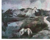
Görsel 3. Antalya Çevresinden (Beyaz At)