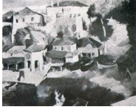
Görsel 7. Antalya Limanı