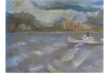
Görsel 6. Limanda Fırtına