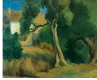
Görsel 2. Antalya'dan Ağaçlı Bir Köşe