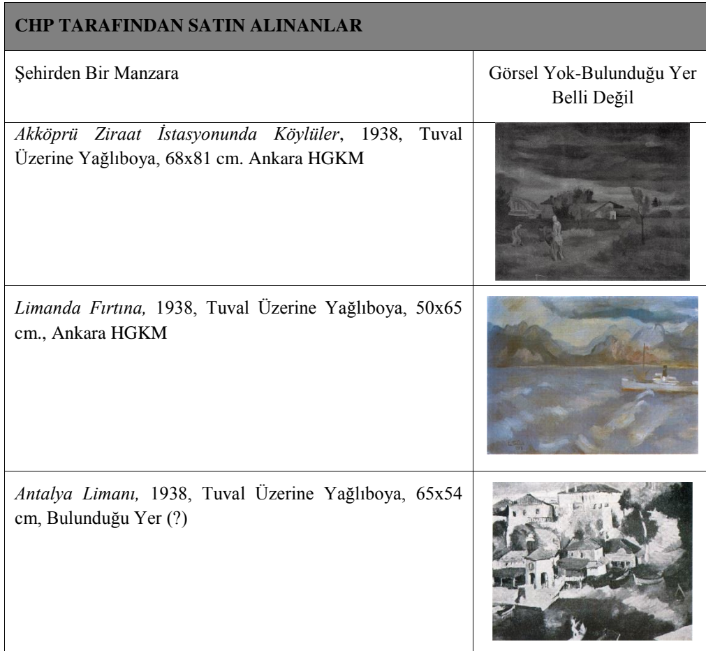
Tablo 3: Cemal Sait Tollu'nun CHP ve Maarif Vekaleti Tarafından Satın Alınan Antalya Resimleri