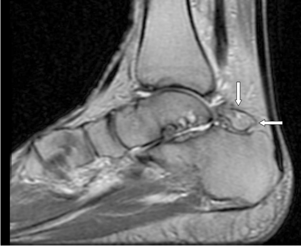
Resim 3: Sol ayak sagittal proton dansite görüntüde kemik sinyal intensitesinde Os trigonum izlenmektedir. (olgu 2).