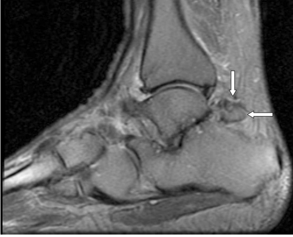
Resim 2: Sağ ayak sagittal proton dansite görüntüde kemik sinyal intensitesinde Os trigonum izlenmektedir. (olgu 2).