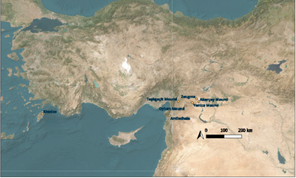
Map 1: Settlements near Yenice Höyük and its immediate surroundings bearing Rhodian amphora stamps. (T. Demir)