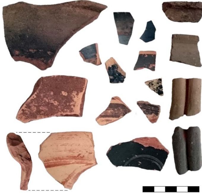
Resim 2: Çiftekaya Tepe Seramik Buluntuları