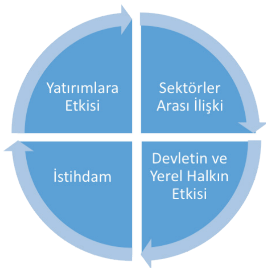
Şekil 2: Turizm Faaliyetlerinin Ekonomiye Olumlu Etkileri. Figure 2: Positive Effects of Tourism Activities on the Economy.

Türkiye'deki turizm gelirlerinin GSMH içindeki payı TÜRSAB verilerine göre 1970 yılında % 0,5'den 1990 yılında % 2,1'e ve 2015 yılında da % 6,2'ye yükselmiştir 2 . Turizmin Türkiye'nin ekonomik kalkınma stratejisinde önemli ve olumlu bir yeri vardır; aynı zamanda hassas dengeleri de içinde