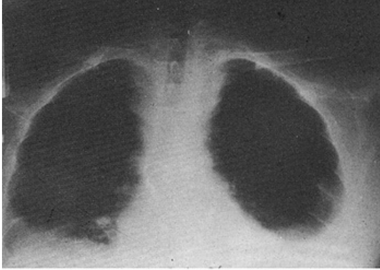
Şekil 1. Bilateral plevral ve perikardial sıvı

amorozu gelişti. Sol bacakta kronik staza bağlı ülser oluşumu dışında stabil seyreden hasta, 1996 Eylülünde dispne, yaygın ödem ve ateş nedeni ile tekrar görüldü. Fizik bakıda oral aftlar, karın ve göğüs ön duvarında yaygın venöz kollateraller mevcuttu. Dinlemekle solunum seslerinde azalma, perküsyonda matite, toraks grafisinde bilateral plevral ve perikardial sıvı saptandı (Şekil 1).