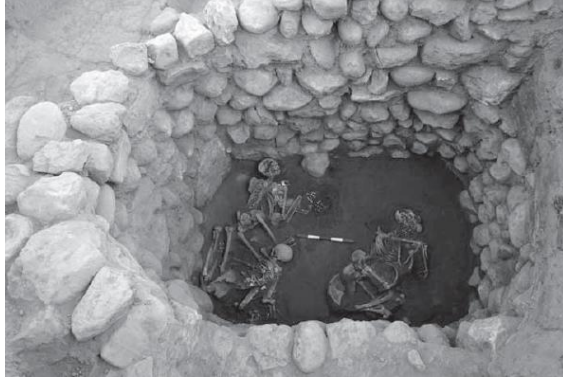
Resim 2. Salat Tepe kuyu Mezar. (Ökse vd, 2010, s. 280).

Salat Tepe'de OTÇ ait kuyu şeklinde örülmüş çukur içerisinde hocker tarzda yatırılmış iki iskelet ile bunların üzerine bırakılmış üçüncü iskelet bulunmuştur (Ökse, Görmüş, Meier ve Bilici, 2010, s. 274).