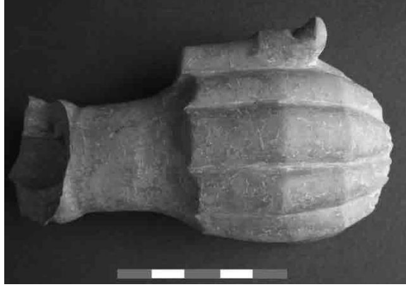
Resim 4. Dede mezarı, libasyon kabı (Üyümez, Koçak ve İlaslı, 2009, s. 194)

Batı Anadolu'da tunç küplar, yalnız Panaztepe mezarlarında ele geçmiş olmakla birlikte, aletler bir diğer önemli buluntu grubudur (Akyurt, 1998, s. 131). K. Bittel'in bildirdiği gibi, MÖ 2. Binin ikinci yarısından itibaren mezarlara silah bırakma geleneğinin görülmesi, Müskebi ve özellikle de Panaztepe mezarlarındaki silahlar, Ege Bölgesindeki Miken aristokrasisinin Batı Anadolu'daki bir etkisi olarak düşünülmüştür (Akyurt, 1998, s. 132). Tunç silahlara Acemhöyük ve Kültepe'de de rastlanmıştır.