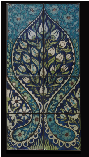
Görsel 13. William De Morgan, Sutlej (P&O Liners), 1882, Siralti, 30x60 cm.