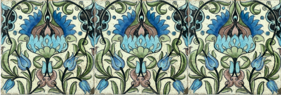
Görsel 12. William De Morgan, Persian Flower , 1888-1897, Siralti, 15x15 cm