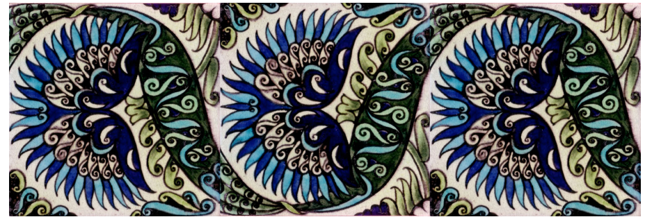
Görsel 10. William De Morgan, Mongolia, 1898, Sıraltı, 15x15 cm