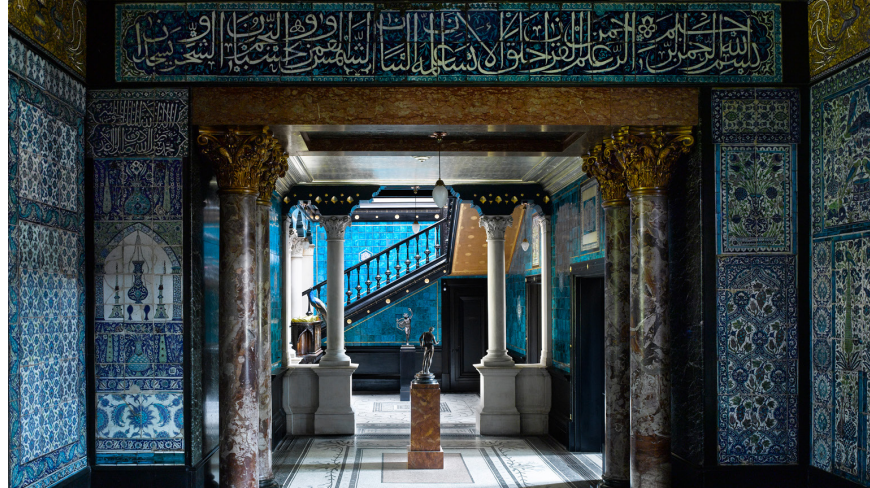
Görsel 3. Leighton House Arab Hall