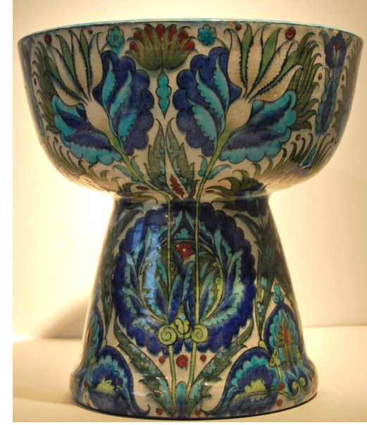
Görsel 20. William De Morgan, Islamic Inspired Jardiniere , 1888-1907, Sıraltı, R:32/H:33 cm.