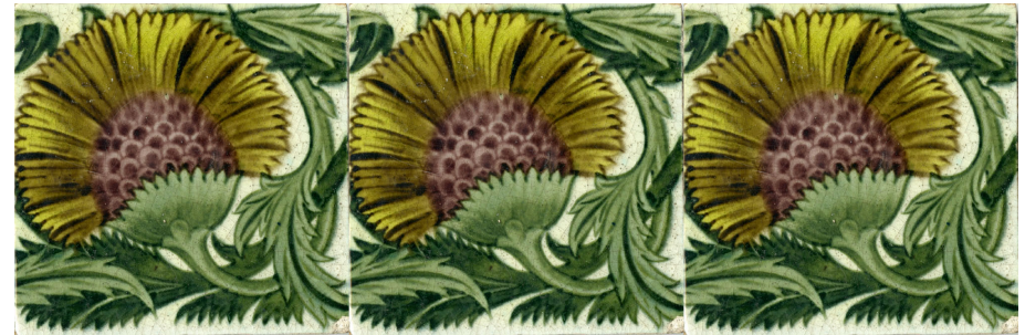
Görsel 9. William De Morgan, BBB, 1882-1888, Sıraltı, 15x15 cm