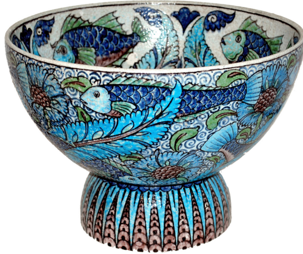
Görsel 19. William De Morgan, Fish Punch Bowl , 1872-1907, Sıraltı, R:37/H: 26 cm.