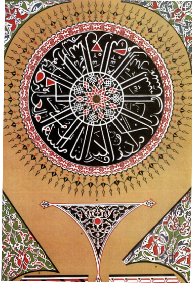
Görsel 1. Türk Süsleme Örneği (Jones, 1986: Pl.37)