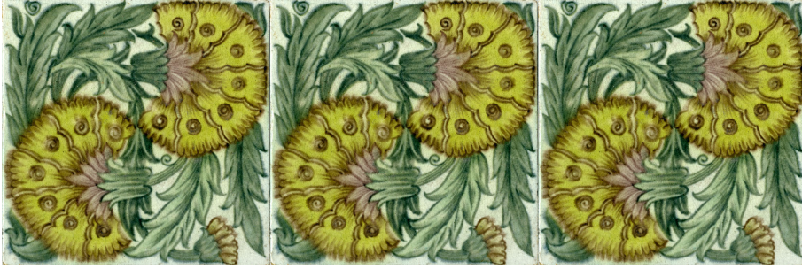
Görsel 11. William De Morgan, Double Carnation, 1888-1897, Siralti, 20x20 cm