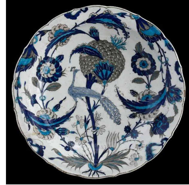
Görsel 6. Şam İşi Üslubunda Tabak (Louvre Müzesi)

Şam İşi üslubunun karakter özellikleri, Osmanlı örneklerinde çiniden ziyade seramiklerde kendini gösterir. Bu üslubun form tipleri, büyük boy ayaklı kase, askı topu, maşrapa, şişe ve vazo gibi açık ve kapalı kaplardır. Tabakların desenlerinde bazen cetvel çizgisiyle bordür alanı ayrılmaksızın desenin tüm yüzeyi kapladığı görülür (Görsel 6).