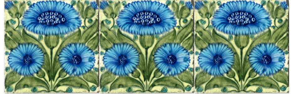
Görsel 8. William De Morgan, Bedford Park Daisies , 1888-1897, Sıraltı, 15x15cm

ve tepelik dizisi gibi biçimler de yine sanatçı tarafından kendine göre yorumlanmıştır (Görsel 13-15).