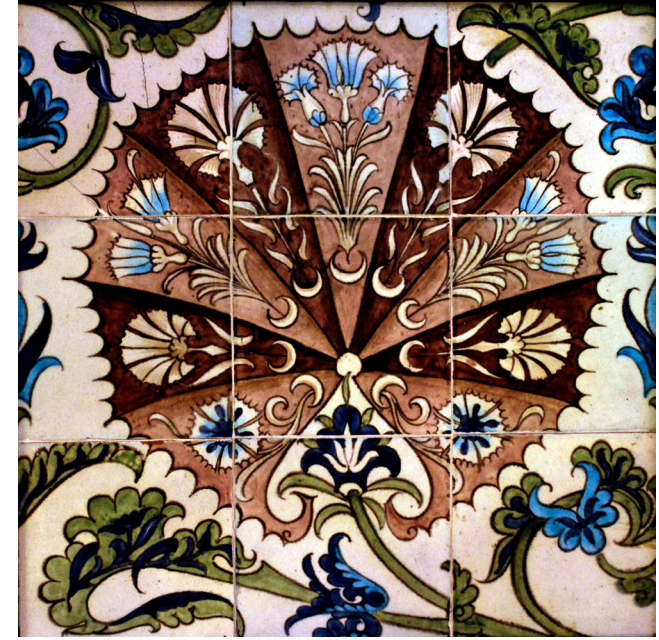
Görsel 14. William De Morgan, Manganese Fan , 1872-1907, Siralti, 49x49 cm.