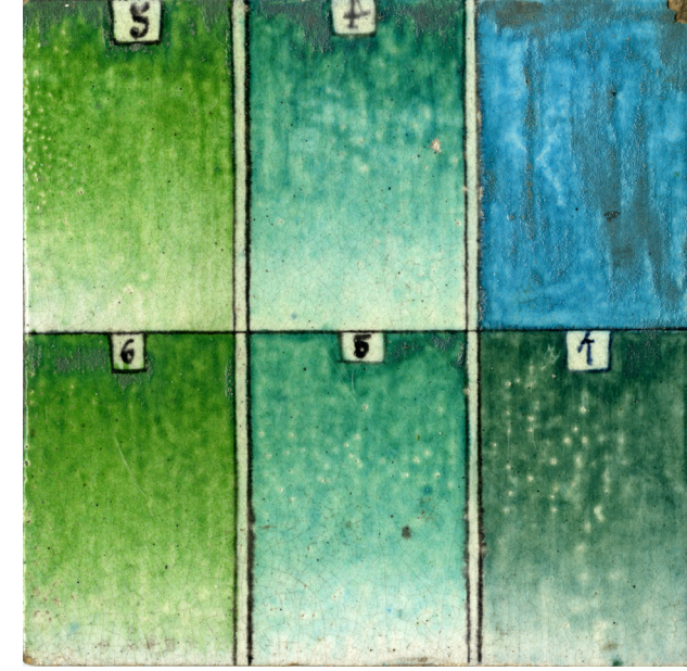
Görsel 17. William De Morgan, Renk Deneme Karosu, 1888-1897, Sıraltı, 15x15 cm.

Orjinallerinde genelde lekese ve iki boyut etkisiyle uygulanan bu renkler, sanatçının işlerinde bazen tonlamalı olarak yorumlanmıştır.