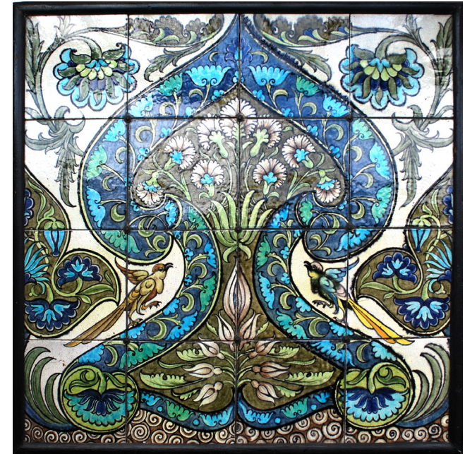
Görsel 14. William De Morgan, Manganese Fan , 1872-1907, Siralti, 49x49 cm.