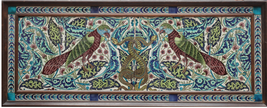
Görsel 16. William De Morgan, Snake & Parrot, Sıraltı