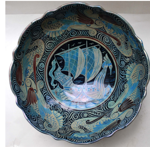
Görsel 2. William De Morgan, Moonlight Kalyon, 1873-1907, Lüster, R:35 cm.