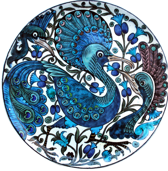
Görsel 18. William De Morgan, Fantastic Peacock , 1888-1907, Sıraltı, R: 35 cm

olabilen balıklar ve yılanlar barışçıl bir şekilde betimlenmiştir (Görsel 19). Tasarımlarda görülen bir başka konu ise açık denizlere yelken açmış İspanyol ve Tudor kalyonlarıdır.