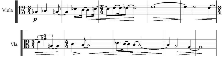
Şekil 1. Yaylı Kuartet No. 2, Op. 35, Birinci Bölüm, Ölçü 1-10

Saygun, on iki ton sistemini kimi eserlerinde ve bu eserin kimi pasajlarının içinde gizlenmiş olarak zaman zaman kullanmış olsa da on iki ton sistemine yakın bir besteci olmamış, bununla ilgili olarak Saydam ile yaptığı söyleşide aşağıdaki düşünceleri beyan etmiştir: