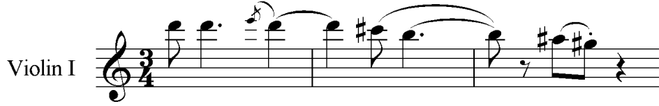
Şekil 8. Yaylı Kuartet No. 2, Op. 35, İkinci Bölüm, Ölçü 38-40 (Gülbey, 2005, s. 66)

İkinci bölüm kırk bir ve elli dokuzuncu ölçüler arasında sırasıyla re diyez aktarımlı hicaz dörtlüsü, sol diyez, si ve mi aktarımlı hüzzam dörtlüsü, fa diyez aktarımlı karıcığar beşlisi, si, re diyez, si ve re aktarımlı hüzzam dörtlüsü ve la aktarımlı karıcığar beşlisi farklı enstrümanlarda duyulmaktadır.