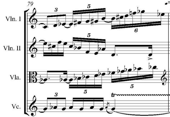
Şekil 12. Yaylı Kuartet No. 2, Op. 35, İkinci Bölüm, Ölçü 79

İkinci bölüm yetmiş dokuzuncu ölçü, Şekil 12.'de verilmiş olup özel bir ölçüdür. Birinci kemandaki serbest kuruluşlu tema, sol hicazkâr makam dizisi 5.-6.-7.-1.-2.-3. derecelerinin ardından do diyeze aktarımlı hicazkâr dörtlüsü ile devam ederken viyolada sol aktarımlı çıkıcı hüzzam beşlisi (la bemol-si bemol-do bemol-re-mi bemol) ile fa bemol aktarımlı çıkıcı lidyen modal dizisi (fa bemol-sol bemol-la bemol-si bemol-do bemol) duyulmaktadır (Gülbey, 2005, s. 73):