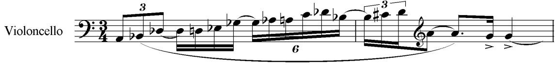
Şekil 11. Yaylı Kuartet No. 2, Op. 35, İkinci Bölüm, Ölçü 77-78 (Gülbey, 2005, s. 73)

Yetmiş yedi ile yetmiş sekizinci ölçülerde, Şekil 11.'de gösterilen ve viyolonselde duyulan dizisel yapıda, la ve re üzerine iki hicaz üçlüsü, bir hüzzam dörtlüsü ve bir hicaz üçlüsü bulunmaktadır: