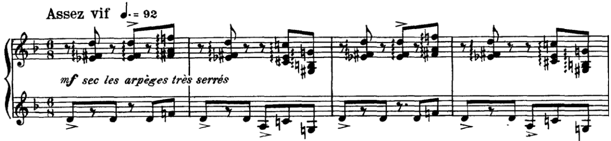
Şekil 4. (ölçüler: 1-4)

Eserde gitar ve kastanyeti 3 andıran Flamenko 4 stilinde ritmik ve melodik figürler bulunmaktadır. Bölüm ilk ölçü itibarıyla İspanyol gitarını taklit edercesine sağ elde gelen kırık akorlar ile başlamaktadır ve 2 ölçüde tamamlanan bir figür sunmaktadır.