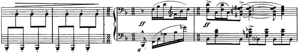
Şekil 7. (Ölçüler: 28-31)

28. ölçüde “p” nüansı içinde decrescendo yaparken birden bire “ff” nüansına geçiş olmaktadır. Notaların üzerindeki aksanlar da gösteriyor ki; 30. ölçünün birinci vuruşundaki kalın si bemol ve 31. ölçünün birinci vuruşundaki ince si bemol sesine önem verilerek çalmak gerekir. Bu pasaj Flamenko dansı yapan çingene kızının topuğunu yere aniden sert bir şekilde vurması ile bağdaştırılabilir.