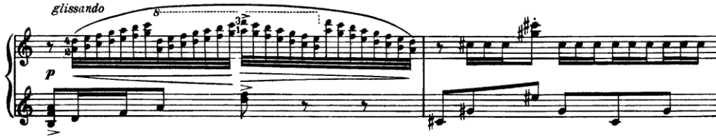
Şekil 11. (Ölçüler: 175-176)

166. ölçüde A bölmesi tekrardan gelmekte ve bu kez “ ppp ” nüansı ile aynı dalgacı karakterde istenmektedir. Sol pedal kullanarak istenilen ses rengi daha rahat çıkacaktır. İlk A bölümünde gam olarak görülen pasaj bu kez “ glissando ” olarak 175. ölçüde dörtlü aralık ve devamındaki tekrarlarında üçlü aralık ile yazılmıştır. Parçanın teknik açıdan yine en zor kısımlarından biri olduğu söylenebilir ve nota üzerinde 2-4 olarak belirtilen parmak numaraları yerine 1-3 de tercih edilebilir. Bu pasajı pedal yardımıyla tuşenin çok fazla içine girmeden daha yüzeysel bir şekilde çalmanın yanı sıra; ele çıkarken sağa, inerken ise sola doğru eğim vermek gerekir.