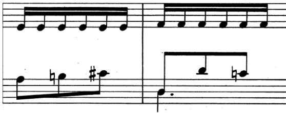
(D. Scarlatti Sonat K. 141 ölçü: 40-41)