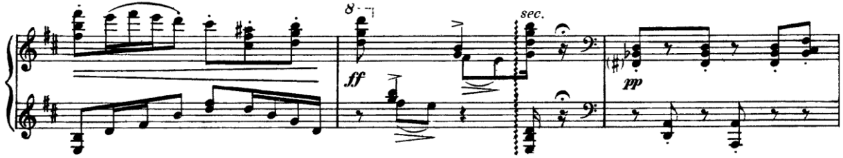
Şekil 13. (Ölçüler: 194-196)

195. ölçüde parça bitiş hissi verip, “ pp ” olarak 196. ölçü itibarıyla Coda’ya bağlanır. Coda kısmında 1, 2 ve 4. temalar karışık halde ve düzensiz ölçüleme ile görülür. Adeta bütün figürleri özet olarak dinleyiciye tekrardan hatırlatır. Ko’ya göre de; Coda’da B bölmesinin dokunaklı karakteri ile A bölmesinin vahşi karakteri kaynaşmıştır (Ko, 2007, s. 85).