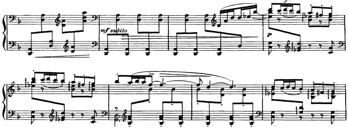
Şekil 6. (Ölçüler: 9-16)

12. ölçüye kadarki kısımda daha çok ritmik bir yapı gözlemlenir ve adeta soytarının şarkısına hazırlık niteliđi taşır. 12. ölçüye aukt (önel) ile giriş yapan ve dört ölçü devam eden melodik yapı ile “soytarı” karakteri kendini göstermektedir.