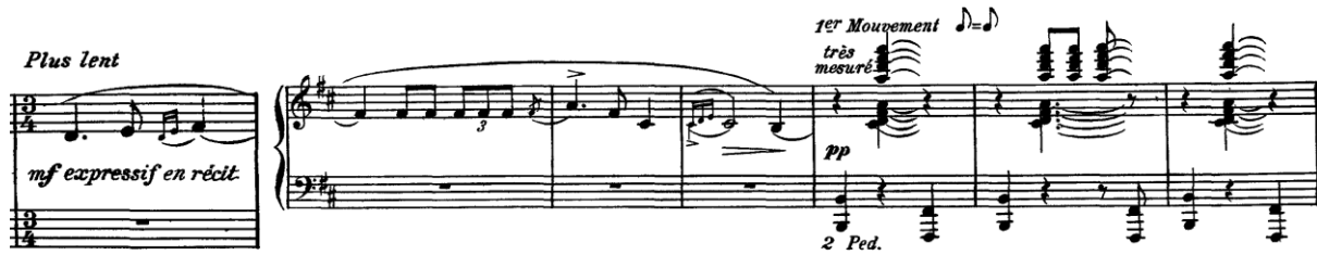
Şekil 9. (Ölçüler: 71-77)

Parçanın orta kısmı (B bölümü) “ Plus lent ” (yavaş) başlığı ve “ expressif en récit ” (ifadeli ve konuşur gibi) terimi ile bambaşka bir karakterde karşımıza çıkar. İlk dört ölçüsündeki sade ve melankolik yapıdaki melodi serbest olup doğaçlama hissi uyandırır. Süsleme notalar vuruşun öncesinde değil tam zamanında çalınmalıdır. (Ko, 2007, s. 76) Ardından gelen dört ölçü ise très mesuré ” (çok ritmik) terimi ile tamamen zıt karakterdedir. Bu atışma B bölümü boyunca düzensiz bir ölçüleme ile yazılmıştır ve melankoli ile alaycı karakteri bir arada sunmaktadır. Roger Nichols bu durumu “ sahte melankoli ” olarak nitelendirmiştir (Nichols, 1977, s. 45). 75. ölçü ile 101. ölçü arasındaki kısımda sol ele yazılmış olan hareketli partinin aksamadan ve temiz çalınması için; oktavları ve akorları çalmadan sadece ele tuşe üzerindeki yerlerini öğretmek adına, eli olabildiğince hızlı bir şekilde hazırlamak gerekir.