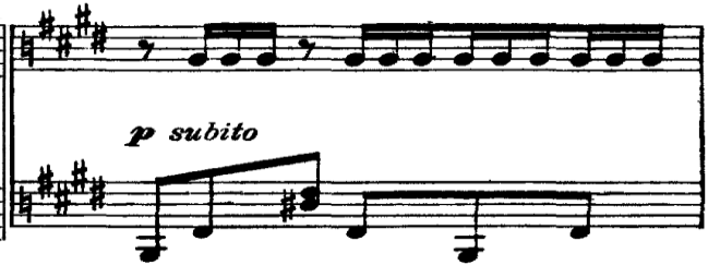
(Alborada del Gracioso ölçü: 43)