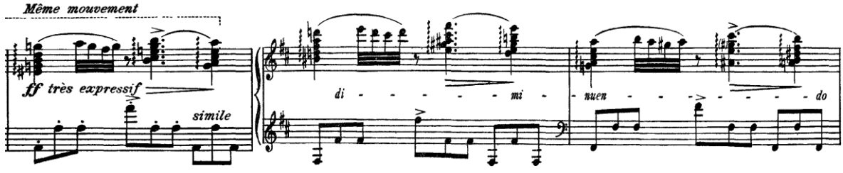
Şekil 10. (Ölçüler: 126-128)

166. ölçüde A bölmesi tekrardan gelmekte ve bu kez “ ppp ” nüansı ile aynı dalgacı karakterde istenmektedir. Sol pedal kullanarak istenilen ses rengi daha rahat çıkacaktır. İlk A bölümünde gam olarak görülen pasaj bu kez “ glissando ” olarak 175. ölçüde dörtlü aralık ve devamındaki tekrarlarında üçlü aralık ile yazılmıştır. Parçanın teknik açıdan yine en zor kısımlarından biri olduğu söylenebilir ve nota üzerinde 2-4 olarak belirtilen parmak numaraları yerine 1-3 de tercih edilebilir. Bu pasajı pedal yardımıyla tuşenin çok fazla içine girmeden daha yüzeysel bir şekilde çalmanın yanı sıra; ele çıkarken sağa, inerken ise sola doğru eğim vermek gerekir.