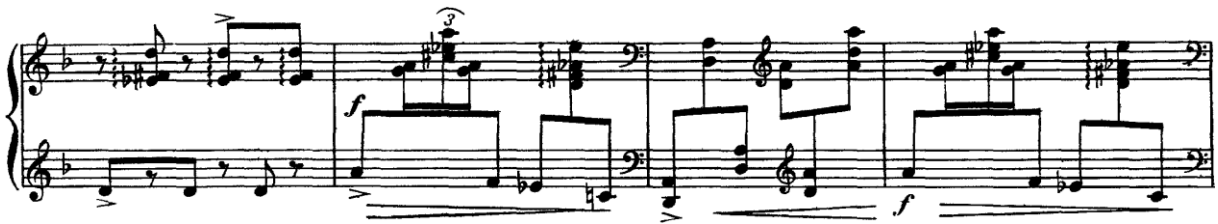
Şekil 5. (Ölçüler: 5-8)

İlk ölçüde görülen “ sec les arpèges très serrés ” ile besteci “ kuru, arpejler çok gergin ” ifadesini kullanmıştır. Aksanlar 1. ve 4. sekizlik notalara denk gelmekte ve çalarken bölümün dinamik yapısını ortaya çıkarmak için bu aksanlara önem verilmelidir. Elleri gergin ve tuşeye yakın tutarak, sağ eldeki kırık akorların üst sesine olabildiğince çabuk ulaşmak hedeflenirse; bestecinin istediği karakter yakalanmış olacaktır. 6. ve 8. ölçülerdeki 1. vuruşa denk gelen sekizlik, onaltılık üçleme ve sekizlik tartım ise kastanyeti anımsatmaktadır.