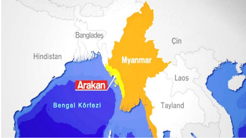
Şekil 1: Myanmar (Burma) ve Arakan Bölgesi Haritası

Bu çalışma içerisinde Arakan'a İslam ve Müslümanların gelişi ve diğer yandan Rohingyaların tarihsel geçmişi ve günümüzdeki şiddet olaylarının arkasından yatan önemli noktalar ele alınarak analiz edilecektir. İslam'ın bölgede nasıl yayıldığını daha düzgün analiz edebilmek ve isabetli değerlendirmelerde bulunabilmek için bölgenin İslamiyet öncesi durumuna değinmek gerekmektedir.