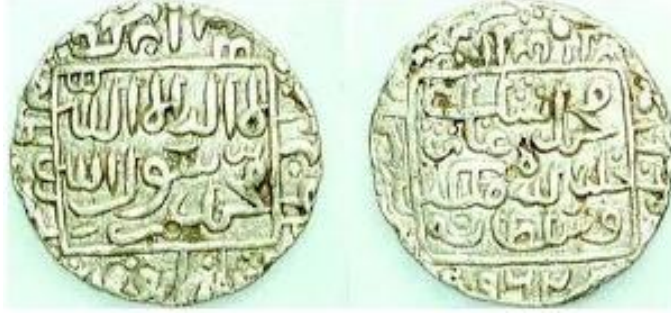
Şekil-5: XVI. Yüzyılda Bengal hükümetinin etkisi altında kalındığı döneme ait bir sikke.

ğa uğramıştır. Narapati tekrar tahta otursa bile 1645 yılında yerine yeğeni Tadamntra geçmiştir. 1652 yılında ülke yönetimi Tadamntra'nın oğlu Sanda Tudamma'nın eline geçmiştir. Sanda Tudamma'nın ölümünden sonra ülke, 1784 yılında Burmalılar tarafından işgal edilinceye kadar yirmi altı kral tarafından yönetilmiştir. 73 Müslüman yöneticilerin içinde bulunduğu taht kavgalarından bunalan bir heyet Burma kralı olan Bodavphaya'ya, Arakan'ın kuşatması için müracaat etmiştir. Bodavphaya da bu fırsatı kabul edip 1784 yılında Arakan'ı kuşatmış ve Arakan'ın bağımsızlığını sona ermiştir.