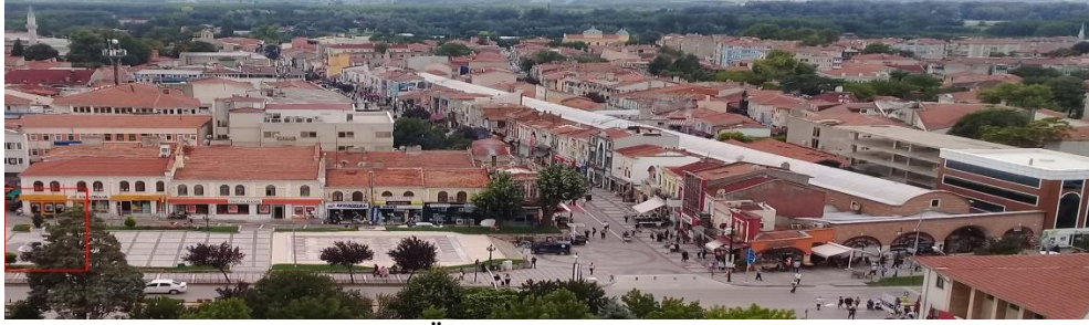
Fotoğraf 7. Anıtın kuzeyindeki Üç Şerefeli Cami minaresinden 1986 sonrası konumu.