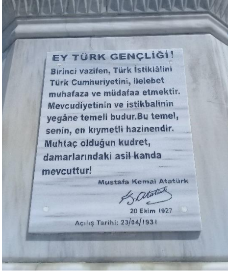
Fotoğraf 17. Anıt kaidesinin güneybatı yönünün üst bölümünde yer alan yazının güncel görüntüsü.