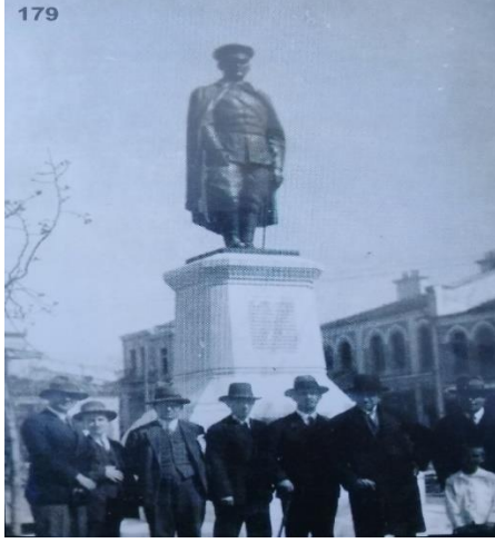
Fotoğraf 15. Anıtın güneybatı yönündeki yazının orijinal halinin de algılanabildiği geçmişteki görünümü.