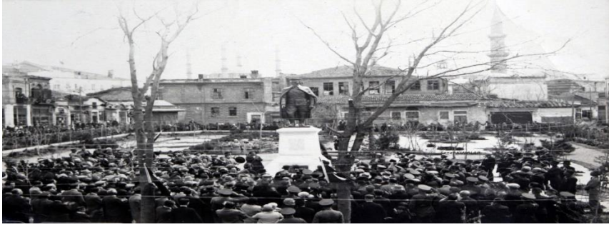
Fotoğraf 2. Heykelin açılış töreninin güneybatı yönünden fotoğrafı.