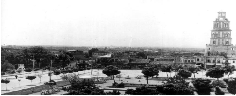
Fotoğraf 3. Açılıştan sonra Kuzey ve Kuzeydoğu yönlerinde yapılan genişletme.