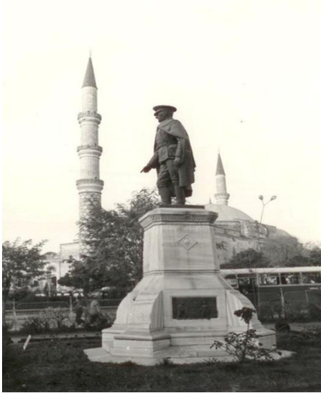
Fotoğraf 4 ve 5. Anıtın 1930'ların sonu ya da 1940'ların başında, demir çit ve tel örgülerle çevrilmiş hali.