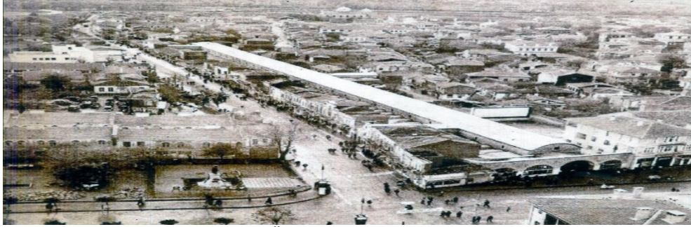
Fotoğraf 6. Anıtın kuzeyindeki Üç Şerefeli Cami minaresinden orijinal konumu.