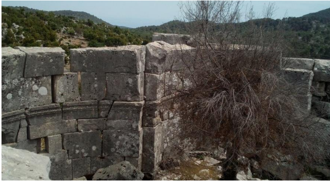
Resim 11: Karabel Nicholaos Manastırı