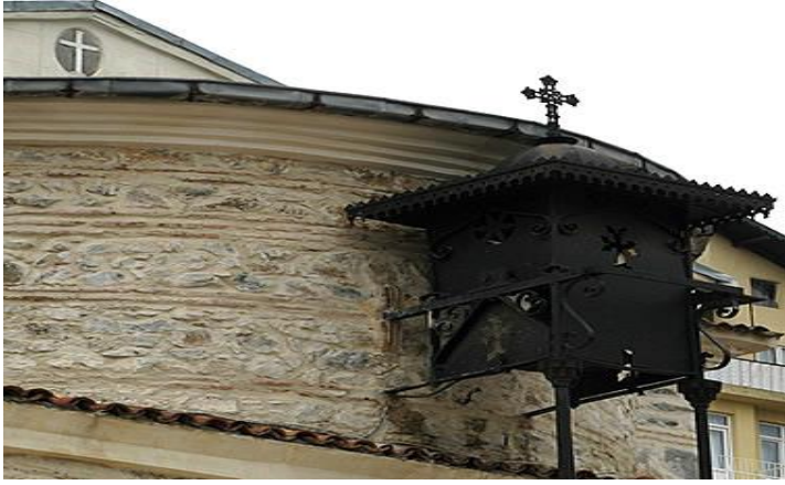
Resim 34: Yeniköy