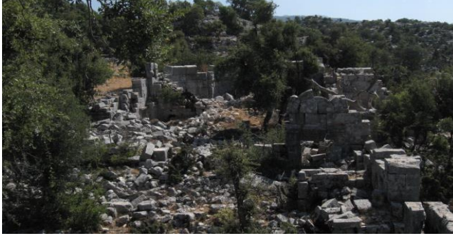
Resim 10: Karabel Nicholaos Manastırı