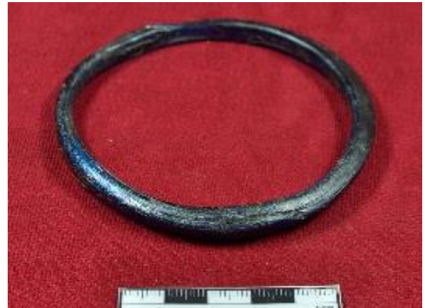
Şekil 6. Cam bilezik

Yapılan kazılarda ortaya çıkarılan seramikler üzerinde çok az motif bulunmaktadır. Fakat seramiklerin hamur tiplerine göre 8 çeşit seramik grubu olduğu gözlemlenmiştir: 1- Kırmızı hamurlu grup, 2- Kırmızımsı-sarı kireç katkılı hamurlu grup, 3- Grimsi-siyah hamurlu grup 4- Siyah, yoğun mika katkılı hamurlu grup, 5- Siyah hamurlu grup, 6- Yeşilimsi-bej hamurlu grup, 7- Yeşil sırlı grup, 8- Rakka grubu. Bu seramik gruplarına bakıldığında kırmızı, kırmızımsı-sarı kireç katkılı, grimsi-siyah, siyah yoğun mika katkılı ve siyah hamura sahip seramikler Bizans dönemine ait seramiklerdir. Fakat daha yeşilimsi-bej, yeşil sırlı ve Rakka seramikleri MS 12-13. yüzyıllara aittirler. Kırmızı hamurlu ve kırmızımsı-sarı kireç katkılı hamurlu grup daha çok Geç Roma Dönemi'ne tarihlenen seramiklerle benzer özellikler göstermektedir. Metal ve cam eserler açısından az buluntu olmasına karşın söz konusu eserler önemli bilgiler vermektedir. Cam eserlere baktığımızda tamamı kırık ve parçalar halinde olan gözyaşı şişelerinin çoğunlukta olduğu gözlemlenmektedir. Şekil 6'da da görüldüğü gibi cam eserler arasında 2 adet bilezik ve çok sayıda boncuk bulunmaktadır.