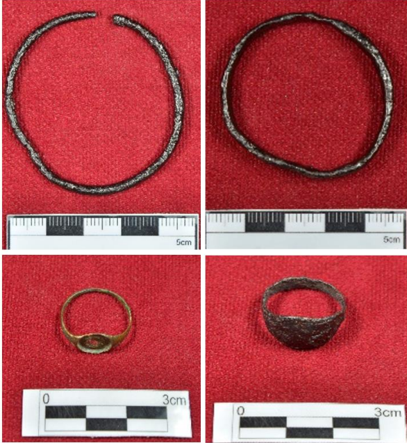
Şekil 8. Bronz ve demirden yapılmış olan bilezik ve yüzükler (soldakiler bronz sağdakiler demir)

İyi korunmuş olarak ele geçen 4 adet bronz yüzükten 3 tanesi üzerinde, çok kötü korunmuş olmakla birlikte, bezeme öğeleri bulunmakla birlikte bir tanesinin ortasında cam kakma tekniğiyle bezeme yapıldığı gözlemlenmektedir. Ele geçen eserler arasında öne çıkan en önemli grup ise Şekil 9’da da görüldüğü gibi telkâri tekniği ile yapılmış olan gümüş küpelerdir. 2010 ve 2011 yılında Nekropol alanının yüzeyinde Bizans Dönemi tabakasındaki sikkeler yoğun olarak bulunmasına karşın 2018 yılında sadece bir adet bronz sikke bulunmuştur. Söz konusu eserin MÖ 4.-5. yy’a tarihlendiği düşünülmektedir (Erdoğan, 2015).