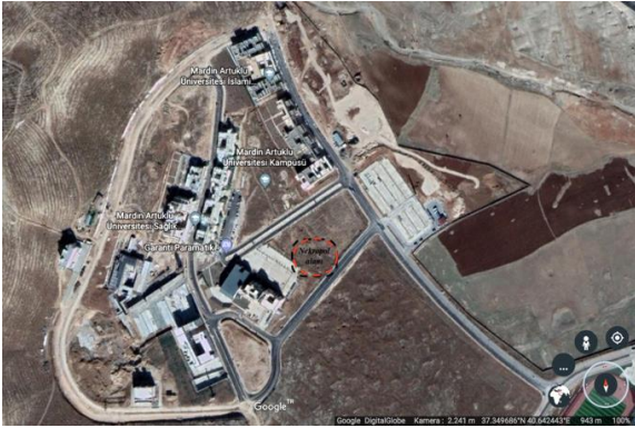
Şekil 1. Nekropol alanının Mardin Artuklu Üniversitesi Kampüsü içerisindeki konumu

Hırbe Helale yerleşim yeri, Mardin-Diyarbakır karayolu güzergâhının 6. kilometresinin batısında yer alan Mardin ili Artuklu ilçesi sınırlarında Mardin Artuklu Üniversitesi yerleşkesi içerisinde yer almaktadır. III. derece sit alanı olarak tescillenmiş olan arkeolojik alanda 2018 yılında yapılan kazı çalışmaları sadece Hırbe Helale yerleşimi yerinde tespit edilen ve Şekil 1’de görüldüğü gibi günümüzde Mardin Artuklu Üniversitesi Güzel Sanatlar Fakültesinin Otoparkının kuzeydoğusunda bulunan alanda gerçekleştirilmiştir. Söz konusu alanda yapılan arkeolojik kazılar 5x5 m ölçülerinde bölünmüş olan sondajlar üzerinden gerçekleştirilmiştir.