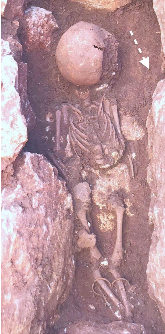
Şekil 5. Çocuk gömülerine ait bir mezar

Basit toprak mezarlarda ise sadece tekli gömülere ait bireylerin olduğu görülmektedir. 4 ayrı basit toprak mezarda ortaya çıkarılan iskeletlerden iki tanesi sol tarafa yan yatırılmıştır. Güneybatı-kuzeydoğu yönünde uzanmış olan iskeletlerin yüzleri doğuya bakmaktadır. Söz konusu iki iskelet üzerinde gözlemlenen bu durum sadece basit toprak mezarlara özgüdür ve taş sanduka mezarlarda gözlemlenmemektedir. Basit toprak mezarlarda açığa çıkarılan diğer iki birey diğer sanduka mezarlarda olduğu gibi güneybatı-kuzeydoğu yönünde ve sırt üstü uzatılmıştır. Şekil 5'te de görüldüğü gibi çocuklara ait olan taş sanduka mezarlar içerisindeki insan kalıntılarında bakıldığında sadece 2-10 yaş arası bireylerin tekli gömüldükleri gözlemlenmektedir. Tekli olmayan bazı çocuk mezarlarında ise yetişkinlere ait iskelet kalıntılarının olmadığı gözlemlenmektedir. Bunun yanı sıra 2018 kazı yılında mezarlar içerisinde ele geçen küpe ve bilezik gibi süs eşyalarının çoğunlukla çocuk mezarlarında bulunduğu görülmektedir.