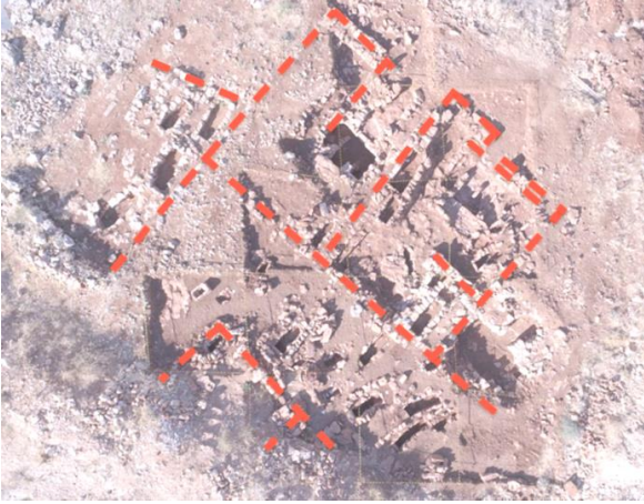
Şekil 3. Mezarlık alanında tespit edilen duvarlar