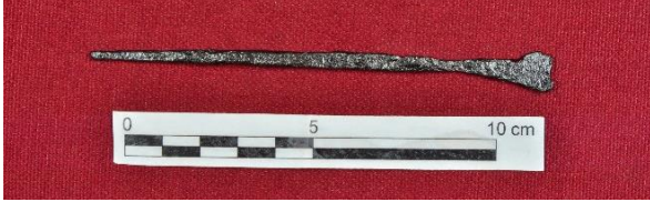
Şekil 7. Mezar içerisinde ele geçmiş olan demir tabut çivisi

Kazı alanında açığa çıkarılan madeni eserler arasında ise bilezikler, küpeler ve yüzükler bulunmakla birlikte Şekil 7’de de görüldüğü gibi demir tabut çivileri yoğunluktadır. Madeni eserler içerisinde ise Şekil 8’de görüldüğü gibi demir ve bronz bilezikler, küpeler ve yüzükler yoğunluktadır. Metal halhal ve bileziklerin açık olan baş kısımlarında hayvan başı şeklinde olan bezeme öğeleri bulunmakla birlikte korozyondan ötürü bu bezeme öğelerinin hangi hayvanları betimledikleri net değildir.