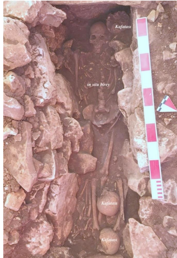
Şekil 4. Yetişkin bireylere ait çoklu bir mezar

Ölü gömme gelenekleri açısından bakıldığında, Şekil 4'te de görüldüğü gibi 2018 yılında açılan tüm mezarlar içerisinde ortaya çıkarılan iskeletlerin tamamının güneybatı kuzeydoğu yönünde uzandıkları gözlemlenmektedir. Şekil 4'te görüldüğü gibi anatomik pozisyonlarını korumuş olan söz konusu bireylerin tamamının yüzlerinin yukarı baktığı ve kollarının leğen kemiği üzerinde yarı kıvrılmış olarak ya da leğen kemiğine paralel şekilde düz olarak uzatıldıkları görülmektedir. Taş sanduka mezarlar içerisinde anatomik pozisyonda olan iskeletlerin baş veya ayak uçlarında daha önceden aynı mezarda gömülü bireylerin etrafında dağınık şekilde toplandıkları görülmektedir. Söz konusu mezarlar içerisinde yeni gömüler yapabilmek için önceden bu mezarlara gömülü olan iskeletlerin toplandığı ve yeni gömülerin bu işlemten sonra yapıldığı gözlemlenmektedir. İn situ durumdaki bireylerin baş bölgelerine yakın bir alanda ya da ayak uçlarında toplanan insan kalıntıları içerisinde kafataslarının bireylere ait uzun kemiklerin üzerine bırakıldıkları örnekler daha yoğundur. Bunun yanı sıra bazı mezarlarda toplama işlemi yapılmadan birkaç bireyin üst üste gömüldükleri de tespit edilmiştir.