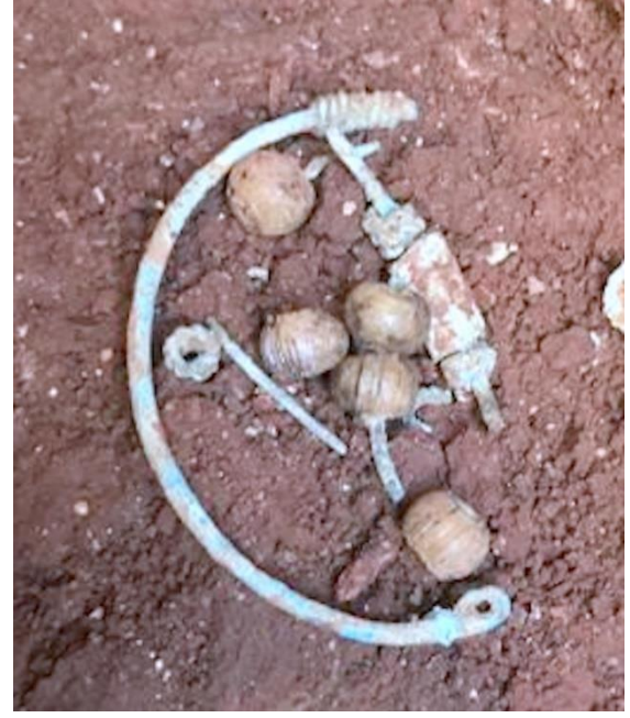
Şekil 9. Telkâri tekniğiyle yapılmış olan ve bir çocuk mezarında ele geçmiş olan gümüş küpe

İyi korunmuş olarak ele geçen 4 adet bronz yüzükten 3 tanesi üzerinde, çok kötü korunmuş olmakla birlikte, bezeme öğeleri bulunmakla birlikte bir tanesinin ortasında cam kakma tekniğiyle bezeme yapıldığı gözlemlenmektedir. Ele geçen eserler arasında öne çıkan en önemli grup ise Şekil 9’da da görüldüğü gibi telkâri tekniği ile yapılmış olan gümüş küpelerdir. 2010 ve 2011 yılında Nekropol alanının yüzeyinde Bizans Dönemi tabakasındaki sikkeler yoğun olarak bulunmasına karşın 2018 yılında sadece bir adet bronz sikke bulunmuştur. Söz konusu eserin MÖ 4.-5. yy’a tarihlendiği düşünülmektedir (Erdoğan, 2015).