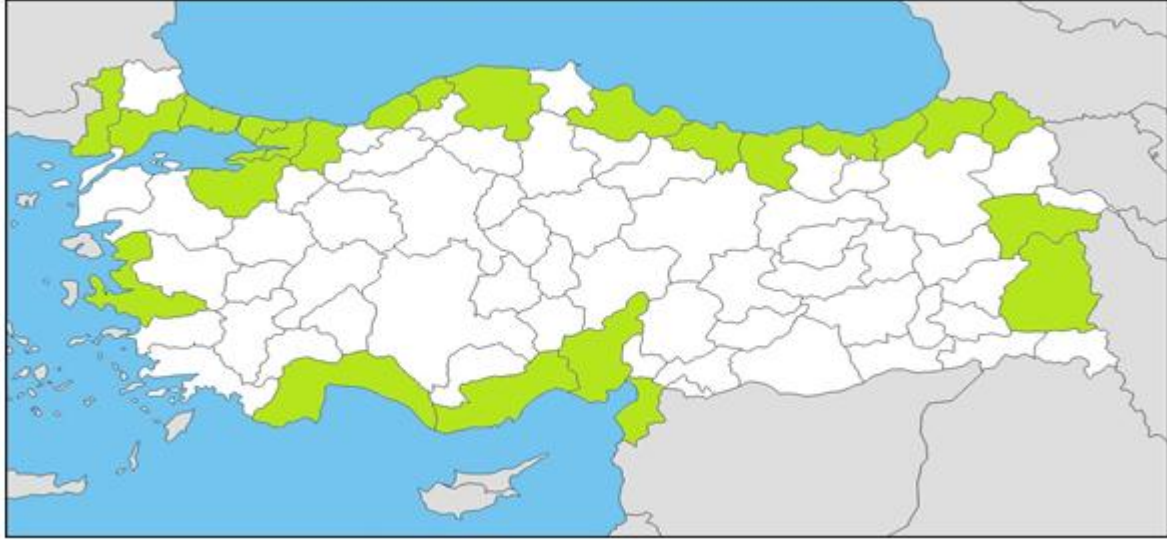
Şekil 1. Ülkemizde Orman Ürünü İthalatında Karantina Kontrolüne Yetkili İller

44.01, 44.03, 44.04, 44.06, 44.07, 44.15 ve 44.16 gümrük tarife istatistik pozisyonlarında yer alan zirai karantina kontrolüne tabi orman ürünlerinin ülkemize girişinde yetkili 24 il ve 48 Gümrük Müdürlüğü bulunmaktadır. Bu gümrük müdürlükleri Şekil 1’ de gösterilen; Adana (1) , Ağrı (1) , Antalya (2), Ardahan (2), Artvin (2), Bartın (1), Bursa (2), Edirne (4), Giresun (1), Hatay (2), İstanbul (5), İzmir (5), Kastamonu (1), Kocaeli (4), Mersin (4), Ordu (2), Rize (1), Sakarya (1), Samsun (1), Tekirdağ (2), Trabzon (1), Van (1), Yalova (1), Zonguldak (1)’ tır (Şekil 1).