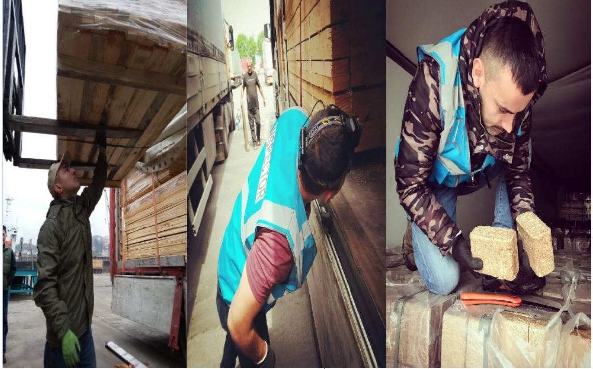
Şekil 2. Bitki Karantinası Kontrol İşlemleri (Zonguldak)

İthal edilmek üzere beyan edilen orman ürünlerinin ağaç türlerine göre dağılımları incelendiğinde; ürünlerin %91,7' sinin çam, % 5,1' inin meşe, %1,7 sinin ladin, %0,7' sinin dişbudak türü olduğu görülmüştür (Şekil 3). Geri kalan % 0,8' lik bölümünü ise düşük miktarlarda işlem yapılan; akçağaç, gürgen, huş, ıhlamur, kavak, kayın, kızılğaç, göknar türleri ile uluslararası ticarete kullanılan ürünleri desteklemekte kullanılan ahşap ambalaj materyali oluşturmaktadır.