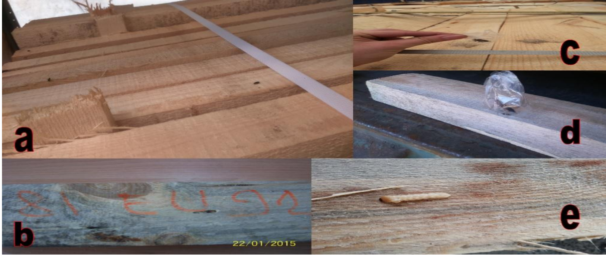
Şekil 4. a) Tomicus piniperda b) Arhopalus spp. c) Aconthocinus aedilis d) Sirex noctilio e) Monochamus spp.

İthalat kaydı ile başvurusu yapılan orman ürünlerinin miktar bazında; 2015 yılında %0,27' si, 2016 yılında %0,55' i, 2017 yılında ise %2,40'ı mahrecine iade edilmiştir. İthalat kaydı ile başvurusu yapılan orman ürünlerinin miktar bazında; %0,073' ü fümigasyon işlemine tabi tutulmuştur.