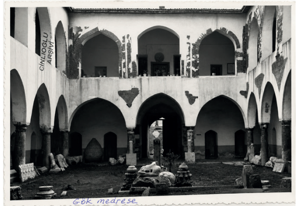
Görsel 3. Tokat Gök Medrese, Müze Döneminden