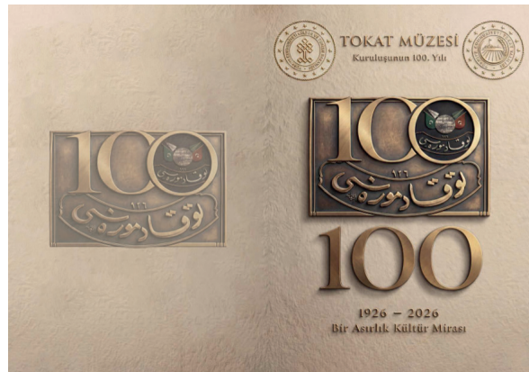
Görsel 1. Tokat Müzesi'nin 100. Yılına Özel Hazırlanan Logo

Cumhuriyet'in ilanını izleyen yıllar, Türkiye için yalnızca yeni bir devlet düzeninin inşa edildiği değil, aynı zamanda savaşın yol açtığı yıkımın giderilmeye çalışıldığı güç bir dönem olmuştur. Kurtuluş Savaşı'nın ardından ülkenin ekonomik kaynaklarının sınırlı olması, devletin kültür, eğitim ve imar politikalarında önceliklerini dikkatli biçimde belirlemesini zorunlu kılmıştır. Bu şartlar altında Maarif Vekâleti bünyesinde yürütülen müzecilik faaliyetleri de dönemin mali imkânsızlıklarından doğrudan etkilenmiştir. Yeni müze binaları inşa etmek yerine, mevcut tarihi yapıların değerlendirilmesi erken Cumhuriyet dönemi müzeciliğinin temel uygulamalarından biri haline gelmiştir. Bu nedenle medrese, bedesten, han, imaret, kilise ve cami gibi artık asli işlevini yitirmiş yapılar, birçok şehirde müze mekânı olarak kullanılmaya başlanmıştır. Ankara'daki Mahmud Paşa Bedesteni ve Kurşunlu Han, Amasya'daki Bayezid Medresesi, Sivas'taki Gök Medrese ile bazı Anadolu şehirlerindeki metruk kilise yapıları bu yaklaşımın dikkat çeken örnekleri arasında yer almaktadır (Gerçek 1999).