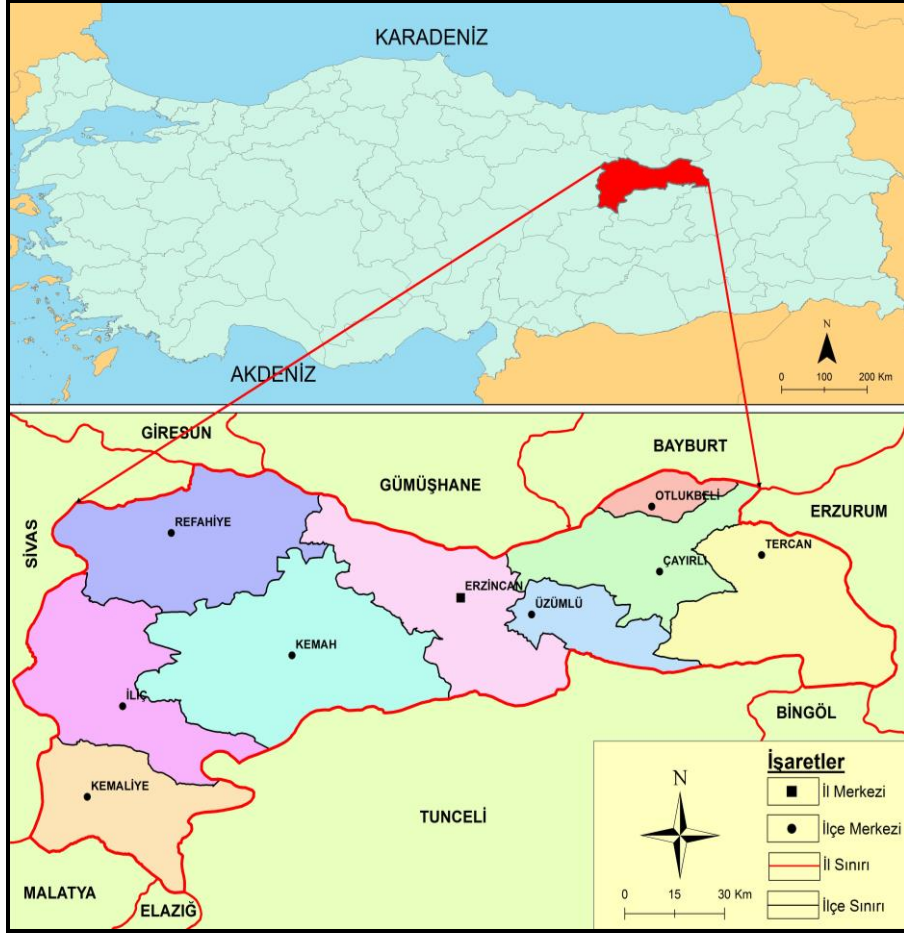
Harita 1. Erzincan ilinin yer bulduru haritası.

Erzincan ili, Doğu Anadolu Bölgesi'nin Yukarı Fırat Bölümü'nde yer almaktadır. Matematik konum olarak yaklaşık 39^{\circ} 02' - 40^{\circ} 05' kuzey enlemleri ile 38^{\circ} 16' - 40^{\circ} 45' boylamları arasında bulunmaktadır. İl toprakları doğudan Erzurum, güneydoğudan Bingöl, kuzeyden Bayburt ve Gümüşhane, kuzeybatıdan Giresun, batıdan Sivas, güneyden Tunceli, güneybatıdan ise Elazığ ve Malatya illeriyle çevrilidir (Harita 1).