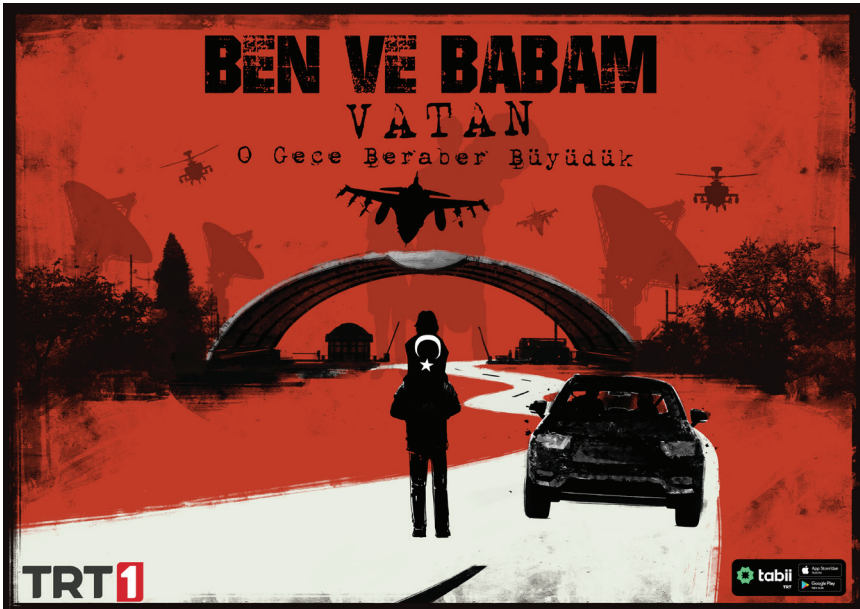
Görsel 2. Ben ve Babam – Vatan (Yönetmen: Berat Özdoğan, 2024) Film Afışı

Filmin elde ettiği reyting başarısı değerlendirildiğinde, AB kategorisinde reklamsız toplamda 2,95, açık olan televizyon ve izlenen programlar arasında 12,48; ABC1 kategorisinde ise reklamsız toplamda 2,99, açık olan televizyon ve izlenen programlar arasında 11,91'lik bir oran yakaladığı, seyircide makul düzeyde karşılık bulduğu anlaşılmaktadır.