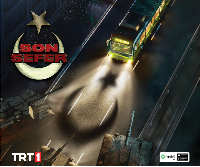
Görsel 3. Son Sefer (Yönetmen: Berat Özdoğan, 2025) Film Afışı

Filmin elde ettiği reyting başarısı değerlendirildiğinde, AB kategorisinde reklamsız toplamda 2,67, açık olan televizyon ve izlenen programlar arasında 14,76; ABC1 kategorisinde ise reklamsız toplamda 2,95, açık olan televizyon ve izlenen programlar arasında 13,82'lik bir oran yakaladığı, seyircide üst düzeyde karşılık bulduğu anlaşılmaktadır.