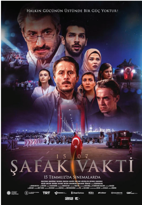
Görsel 1. 15/07 Şafak Vakti (Yönetmen: Volkan Kocaturk, 2021) Film Afışı

Filmin elde ettiği reyting başarısı değerlendirildiğinde, AB kategorisinde reklamsız toplamda 2,43, açık olan televizyon ve izlenen programlar arasında 10,87; ABC1 kategorisinde ise reklamsız toplamda 2,44, açık olan televizyon ve izlenen programlar arasında 9,66'lık bir oran yakaladığı, seyircide makul düzeyde karşılık bulduğu anlaşılmaktadır.