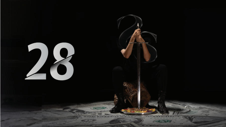
Görsel 5. Yirmi Sekiz (Yönetmen: Emrah Sendur, 2023) Film Afişi

Filmin elde ettiği reyting başarısı değerlendirildiğinde, AB kategorisinde reklamsız toplamda 1,45, açık olan televizyon ve izlenen programlar arasında 6,46; ABC1 kategorisinde ise reklamsız toplamda 1,21, açık olan televizyon ve izlenen programlar arasında 5,22'lik bir oran yakaladığı, seyircide nispeten makul düzeyde karşılık bulduğu anlaşılmaktadır.