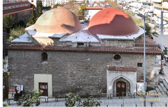
Resim 1. Selanik Hüsrev Kethüda Hamamı (Yeni Hamam) 18

nında yoğun bir şekilde kullanılmış olması muhtemeldir (Erdoğan vd., 2016: 94, 96). Tarihi süreçte çeşitli tamirler geçiren hamamla ilgili en esaslı tamirlerden biri H. 1218/M. 1803-1804 yılında yapılmış ve hamamın yıllık gelirinin ¼'ü kubbelerinin tamiri için sarfedilmiştir (BOA, EV.HMH.d., 7782). Hamam, işlevini 1917 yılındaki Selanik yangınına kadar sürdürmüştür. 1919'da Yunanistan'ın mülkiyetine geçtikten sonra yerli bir tüccara satılan hamam, 1937 yılına kadar durumunu muhafaza etmiştir. Tüccarın önce ambar, sonra sinemaya (Aigli Sineması) dönüştürdüğü yapının büyük bir kısmı yıktırılmıştır. 1978 depremine kadar sinema olarak kullanılan yapının bazı eklentileri zarar görünce boş alanları açık hava sineması olarak kullanılmış, 1980'lerde ise "Sevilla Tavernası" adıyla faaliyet göstermiştir (Erdoğan vd., 2016: 94, 96). 2000 yılında kapalı ve harap durumda olan ve kendi kaderine terk edilen yapının kitabesi de yok edilmiştir (Bıçakçı, 2002: 436). 2000'li yılların başlarında özel bir kültür merkezi olarak kullanılan hamam (Yapar, 2007: 297) günümüzde özel sektör tarafından gece kulübü olarak işletilmekte, tarihi ve turistik özelliğini devam ettirmektedir (Erdoğan vd., 2016: 96).