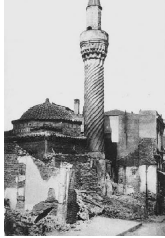
Resim 2: Selanik Burmalı Camii (1917 Selanik Yangını Sonrası) 36