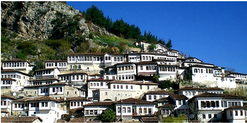
Resim 1. Berat şehir manzarası.

Osmanlı döneminde toplumsal, ekonomik, sosyal ve kültürel gelişmenin özellikleri açısından en tipik şehirlerden birisi olan Berat diğer adıyla Arnavut Belgradı, Adriya Denizi'ne dökülen Semen (Semeni) Nehri'nin Osum (Usumi) kolu üzerinde ve Tomorrit Dağı'nın batı eteklerine kurulmuştur. Şehrin üst kısmında 19. yüzyıla kadar stratejik önemini korumuş olan bir kale yer alır. Havası ağırca ise de etrafında bağ ve bahçe çoktur (Giray, 1992: 473-475).