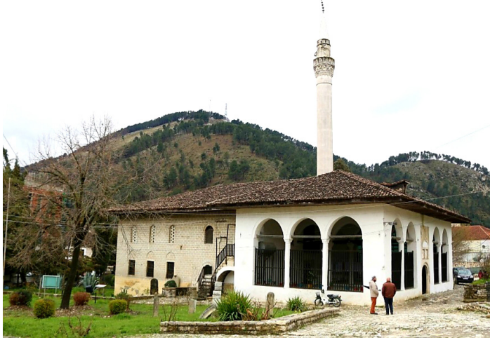
Resim 3. Berat Sultan Bayezid Camii

belirtilmektedir. Diğer taraftan Kaplanzâde İbrahim Paşa'nın 1797 tarihli vakfiyesinde kale içinde bulunan "Fatih Sultan Mehmed Camii"nin tamirinin yapılması şartı, her ne kadar Evliya Çelebi ve Kiel'in çalışmasında zikredilmese de bu caminin mevcudiyetini ortaya koymaktadır.