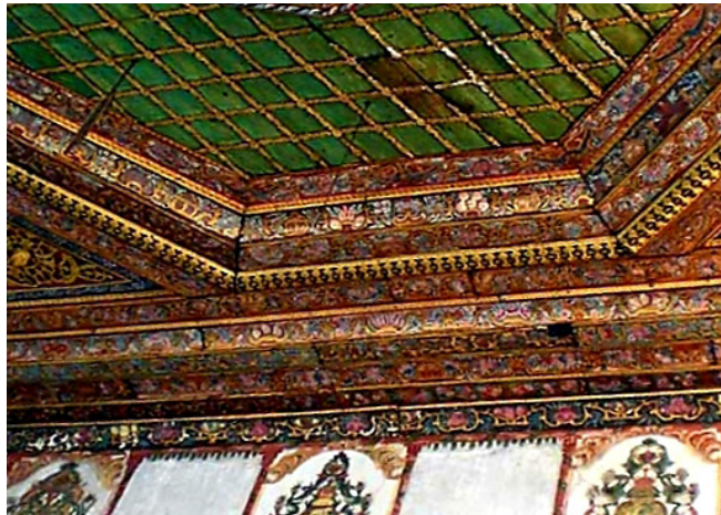
Resim 5. Şeyh Hasan Halvetî Tekkesi tavan süslemelerinden bir detay.

bir üslup ile yapılmış olup, daha çok Batı Anadolu ve Balkanlar'daki diğer bezeme örnekleri ile teknik ve üslup açısından benzerlikler göstermektedir (Uçar, 2017: 532).