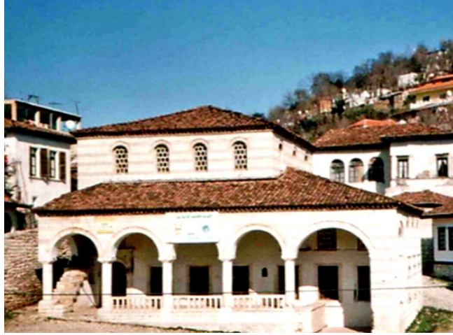
Resim 4. Şeyh Hasan Halvetî Tekkesi.

olarak inşa edilen zaviyenin, Kurt Ahmed Paşa tarafından yeniledikten sonra Celvetî Tekkesi olarak hizmetini ifa ettiği ihtimalini akla getirmektedir ki, tekkenin Celvelilere ait olduğunu belirten kitabe de bunu teyit etmektedir. (Tütüncü, 2017: 135-137). Ayrıca 1242/1826 tarihli Kaplânzâde Süleyman Paşa vakfiyesinde tekkenin Sultan Bayezid Camii civarında olduğunun ve Aziz Mahmud Hüdai Hz. Hulefasından Şeyh Bayezid Tekkesi olarak belirtilmesi ve tekke dervişleri için vakıftan tahsisat yapılması da tekkenin bir Celvetî Tekkesi olduğunu ortaya koymaktadır.