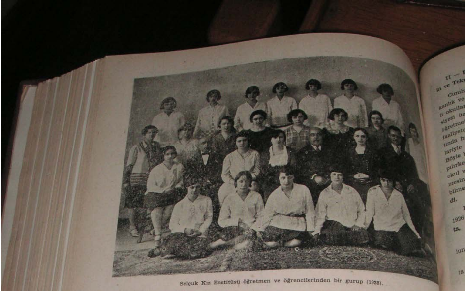
Fotoğraf 2. Selçuk Kız Enstitüsü öğretmen ve öğrencilerinden bir grup (1928). Mesleki ve Teknik Öğretim , Ekim 1961, Sayı: 104.