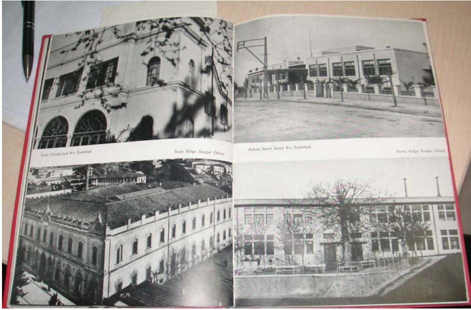
Fotoğraf 5. Üstte solda İzmir Cumhuriyet Kız Enstitüsü, sağda Adana İsmet İnönü Kız Enstitüsü, altta solda İzmir Bölge Sanat Okulu, sağda Bursa Bölge Sanat Okulu ( Kız Enstitüleri ve Sanat Okulları , 1938).