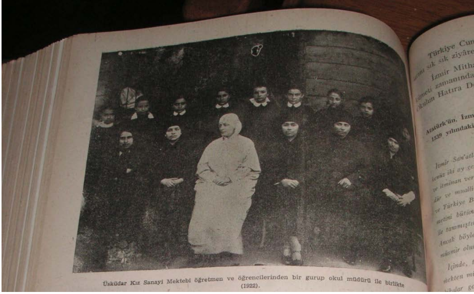
Fotoğraf 1. Üsküdar Kız Sanayi Mektebi öğretmen ve öğrencilerinden bir grup. Okul Müdürü ile birlikte (1922). Mesleki ve Teknik Öğretim , Ekim 1961, Sayı:104.