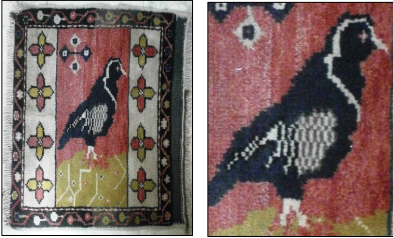
Şekil 4: Döşemealtı Kuşlu Halı Örneği 1

Döşemealtı halı örneği 2; yastık amacıyla dokunmuştur. Halının etrafını çevreleyen yeşil rengin hakim olduğu bir kalın bordür ile kırmızı kontürlü lacivert üçgenlerden oluşan ve zemini hardal renginde olan bir ince bordür bulunmaktadır. Halının zemininde hardal renk hakimdir ve siyah, kahverengi, gri, sarı ve kırmızı renklerden oluşan ve birbirine bakan tasvir edilmiş iki güvercin motifi göze çarpmaktadır. Zeminde ayna simetrisi raportlama tekniği kullanıldığından, halının yarısında güvercinin üstüne yerleştirilen çiçekler ile önüne yerleştirilmiş vazodaki çiçekler, halının diğer yarısında tam tersi olacak şekilde aynı motifler yer almaktadır. Halılarda yer alan, iyi talih, mutluluk, sevinç ve haberciliği sembolize eden güvercinler buldukları yere geri dönme becerileri ve dış güzellikleri ile de bilinmektedir (Yılmaz ve Boz, 2012: 49). Yön bulma yeteneği ve hızları sayesinde Türkmen boylarında ve Osmanlı döneminde haberleşme amacıyla posta güvercinleri yetiştirilmişse de, günümüzde hobi olarak güvercin yetiştiriciliği devam etmektedir (Özer, 2015: 183).