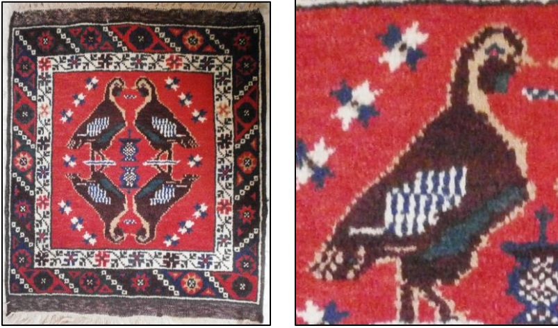
Şekil 6: Döşemealtı Kuşlu Halı Örneği 3

Döşemealtı halı örneği 4; minder amacıyla dokunmuştur. Halının etrafını çevreleyen daire içinde yıldız, üçgen, göz motiflerinden oluşan ve zemininde lacivert, açık mavi, açık kırmızı, koyu kahverengi renklerin kullanıldığı kalın bordür ile beyaz, kırmızı renkli ince bordür bulunmaktadır. Halının zemininde yeşil renk hakimdir ve krem, beyaz, koyu kahverengi ve kırmızı renklerden oluşan ve birbirine bakan tasvir edilmiş iki keklik motifi göze çarpmaktadır. Zeminde ayna simetrisi raportlama tekniği kullanılmıştır. Ayrıca halının zemininde yüzeyde dağınık halde yerleştirilmiş farklı büyüklükte yıldız motifleri, çiçek motifleri ve iki kekliğin ortasında vazoda çiçek motifi yer almaktadır.