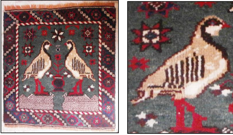
Şekil 7: Döşemealtı Kuşlu Halı Örneği 4