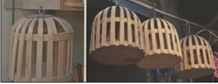
Şekil 3: Keklik Kafesi (Akpınarlı vd., 2014: 91).

Yörede yapılan araştırmada saptanmış olan 4 kuş motifli halının özellikleri şöyledir;