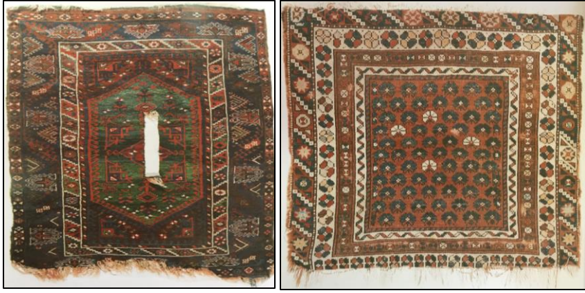
Şekil 2: 19. Yüzyıl Döşemealtı Halı Örnekleri (TEDHK, 2006)

Döşemealtı halılarındaki motife yanış, motifleri birbirinden ayıran kuşaklara da su denilmektedir. Arap (çırakman), el, şingır, deve, akrep, heybe suyu, bıçak ucu, tutmaç top, mektup, mersin yaprağı topu, yantır, kocasu, bulanık su, çetene, çingilli, yastık yanışı, aklı su, böcü (koyun gözü), nacaklı su, albay suyu, küçük toplu su ve kırmızı toplu su Döşemealtı halılarında kullanılan motiflerdendir (Deniz ve Aydın, 2012: 430). Halılarda kullanılan bordürler ise kocasu, develi su, tutmaç suyu, çetene, nacaklı su, küçük toplu su, albay suyu, aklı su, bulanık su, kırmızı toplu su ve çingillidir. Bordürlerin içerisinde deve, testere dişli yaprak, çiçek, yantır, mersin yaprağı topu, şingır, koyun gözü ve bıçak ucu vb. motifler yer almaktadır (Aldoğan, 1981).