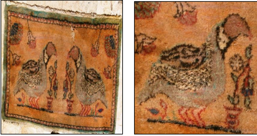
Şekil 5: Döşemealtı Kuşlu Halı Örneği 2

Döşemealtı halı örneği 3; minder amacıyla dokunmuştur. Halının etrafını çevreleyen koyu kahverengi kalın bordür, beyaz renkli ince bordür, daire içinde yıldız, üçgen ve göz motiflerinden oluşan zeminde yeşil, lacivert renklerin hakim olduğu bir kalın bordür ve zeminde beyaz rengin hakim olduğu su yolu şeklinde dolaşan çiçek motiflerinden oluşan bir ince bordür bulunmaktadır. Halının zemininde kırmızı renk hakimdir ve krem, koyu kahverengi, lacivert, beyaz ve yeşil renklerden oluşan ve tasvir edilmiş dört keklik motifi göze çarpmaktadır. Zeminde ayna ve ters simetri raportlama tekniği kullanılmıştır. Halının dörtte birinde yer alan keklik motifini ayna simetrisi ve ters simetrisi alınarak raportlanmıştır. Ayrıca zeminde beyaz-mavi renkli çiçek motifleri ile krem, koyu kahverengi, lacivert renkli vazolar yer almaktadır.