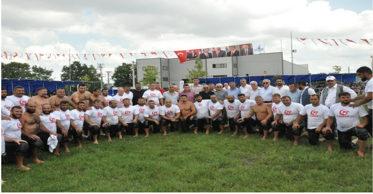
Foto 6. Heregeleci İbrahim Yağlı Güreşleri Sporcular - 2017

güreşlerin yapıldığı bir alan olarak özel olarak inşaa edilmiştir (Foto 4). Daha önceleri bu alan At İdman Merkezi olarak da kullanılmıştır.