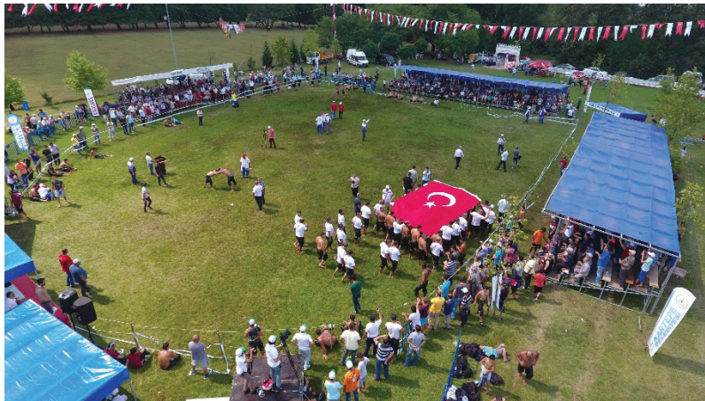
Foto 5. Sarımeşe Yağlı Güreş Alanı