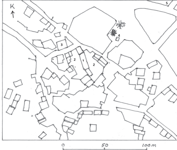
Şekil 2. Konağın Alemşah köyündeki konumu (1-Konak 2- Avlu 3-Köy camisi 4-Çeşme 5-Mezarlık)