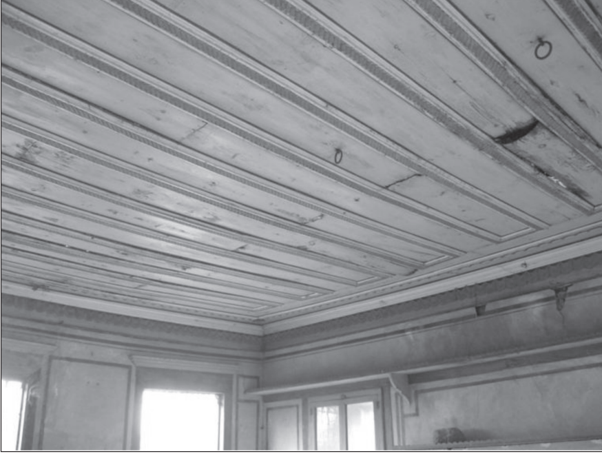
Resim 11. Baş odanın tavanı