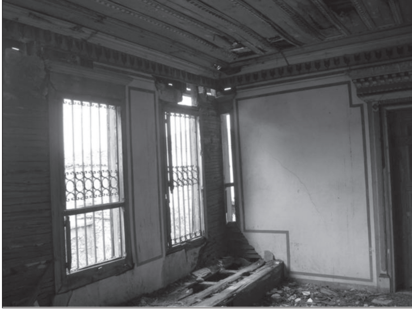
Resim 5. Sofanın batı tarafında sedir ve pencereler