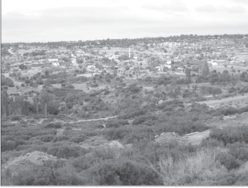
Resim 1. Alemşah köyünün genel görüntüsü