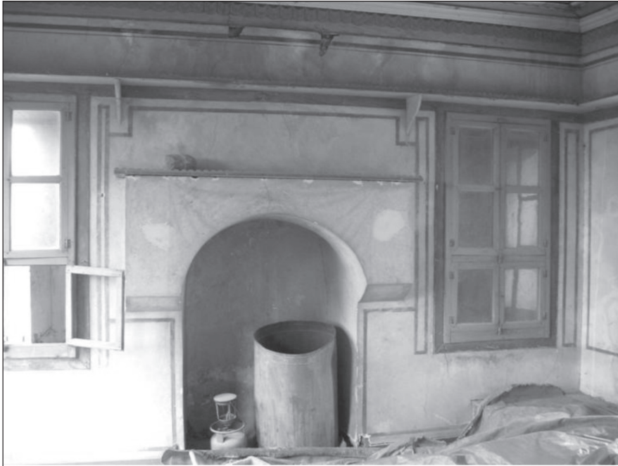
Resim 8. Bař odada ocak cephesi