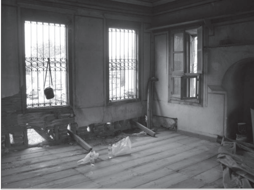
Resim 9. Baş odanın kuzeybatı köşesi