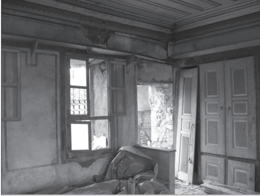
Resim 7. Bař odanın gneydoęu křesi