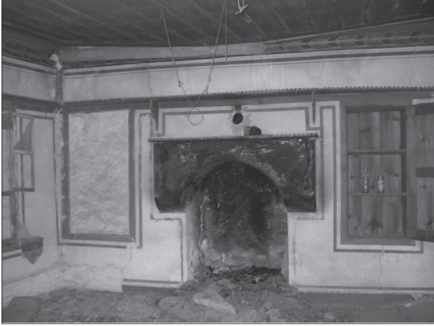
Resim 13. Güney odada ocak cephesi