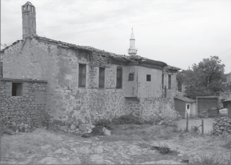
Resim 4. Güney ve doğu cepheler