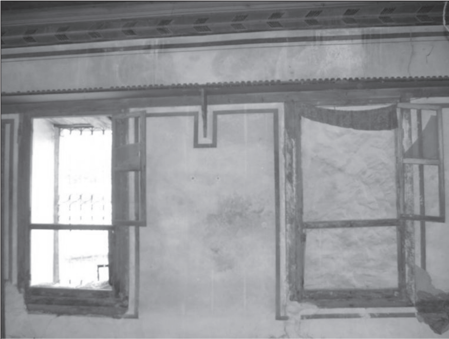
Resim 12. Güney odanın doğu duvarı