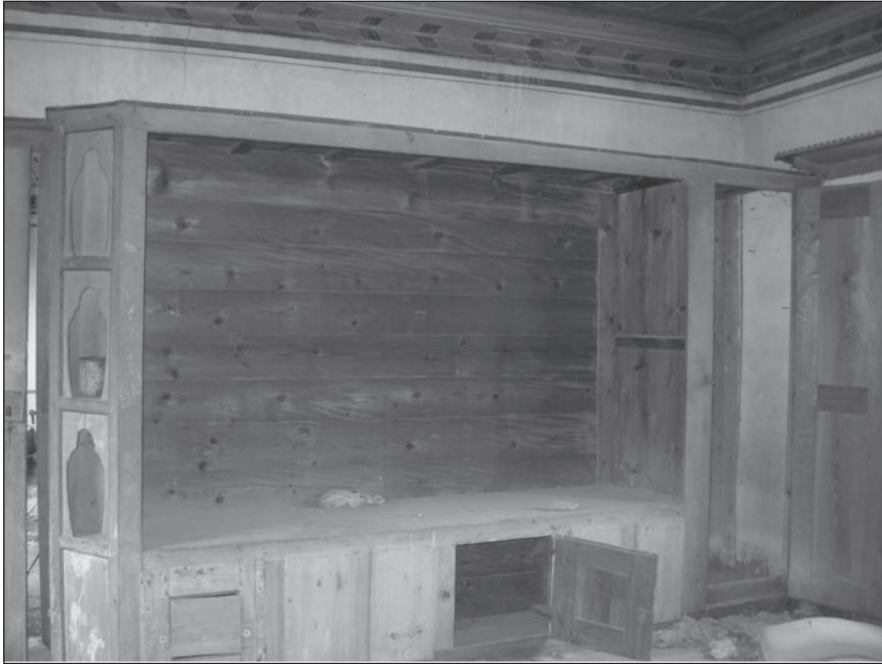
Resim 14. Güney odada yükük ve gusülhane