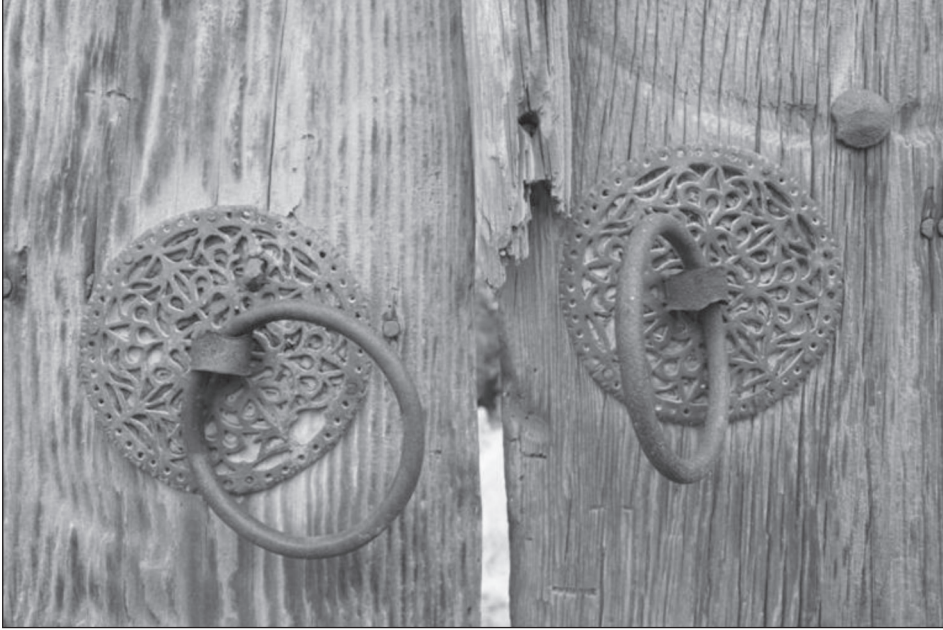
Resim 2. Avlu kapısındaki tokmaklar