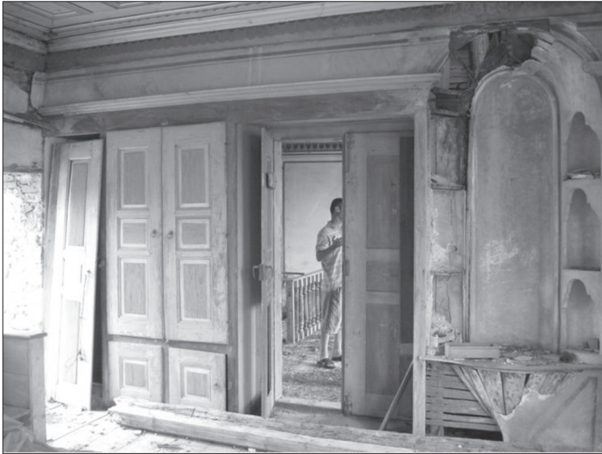
Resim 10. Baş odanın güney kanadındaki dolaplar