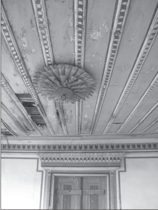
Resim 6. Sofanın tavan göbeği