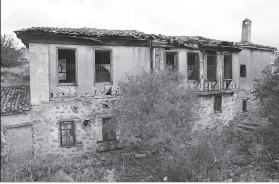
Resim 3. Batı cephe