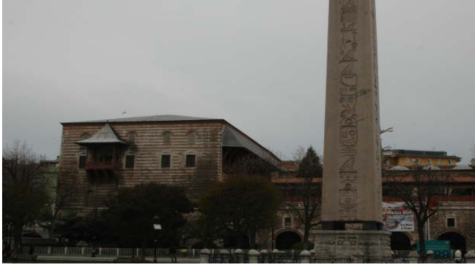
Fotoğraf 13. İstanbul, Sultan Ahmet Meydanı ve İbrahim Paşa Sarayı

Kanunî ailesinden kız kardeşi Hatice Sultan (Uluçay, 1985, s. 32) ile önceleri has odabaşı olan, sonradan hızlı bir yükselişle teamüllere aykırı şekilde çeşitli unvanlarla sadrazamlığa yükselttiği Parga'lı/Makbûl/Maktûl İbrahim Paşa adına bir saray yaptırmıştır (Gökbilgin, 1977, ss. 908-915; Emecen, 1999, ss. 637-638; Jenkins, 2011, ss. 1-113), Bir zamanlar At Meydanı'nın batı kenarında, hâkim bir noktada yer alan kâgir sarayın Sultan Süleyman tarafından kız kardeşi ile eniştesi adına 1524 yılındaki evlilik töreni için düğün hediyesi olarak sunduğu kabul edilir (Atasoy, 1972; Sakaoğlu, 1993, ss. 414-418; Artan, 1994, ss. 128-130; Turan, 2007; Artan, 2012, ss. 78, 124). Saray büyük ölçüde geçirdiği onarımlarla değişse de Osmanlı döneminin İstanbul'daki tek ve en büyük vezir sarayı olma ayrıcalığını taşımakta ve bugün Türk İslam Eserleri Müzesi olarak kullanılmaktadır (Fotoğraf 13).