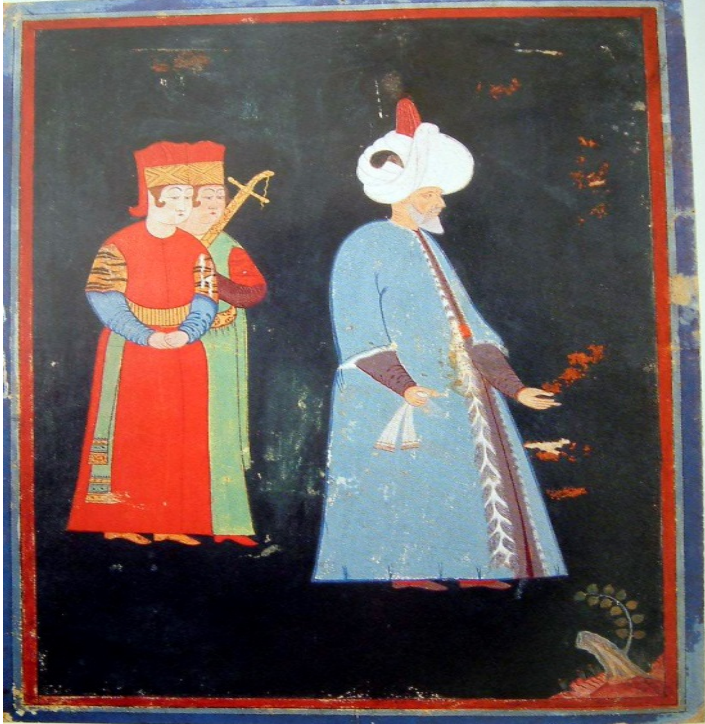
Minyatür 1. Sultan Süleyman ve Saray Görevlileri (Nigari'den)

2010, s. 63). Mevcut betimlemelere göre fiziki açıdan uzun boylu, zayıf ve esmer tenli olduğu anlaşılan Kanunî'nin (Minyatür 1) kişilik olarak kararlı, adaletli, ailesine karşı duyarlı, gerektiğinde en yakınlarını katlettirecek kadar da acımasız olduğu bilinir. Tarih sahnesine çıktığı 1520-1566 tarihleri arasındaki yıllar Osmanlı Devleti'nin yükselme dönemi olarak kabul edilir. Bu zaman aralığına yerleşen mevcut vakfiye, kitabe, mühimme defteri, rûzname, vakayiname, tahrir defteri ve seyahatname gibi yazılı kaynaklar ile gravür ve minyatür gibi görsel belgeler bu dönemin siyasi, sosyal ve kültürel anlamda çok gelişmiş olduğunu göstermektedir 2 . Aynı zamanda Osmanlı Devleti'nin içinde bulunduğu Akdeniz coğrafyası ile siyasi, kültürel ve ticari alışverişler yoğunlaşmıştır.