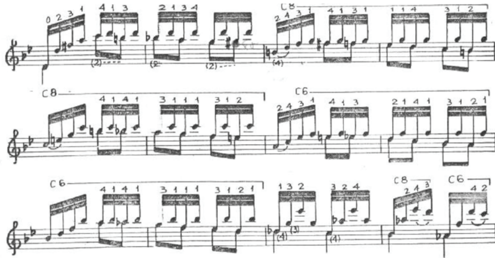
Görsel 3. Prelüd 72-83. ölçüler

Barrios'un, "Bach'ın müziği bizleri nasılda ebediyete yüceltiyor. söyleminden de Bach'a karşı olan tutkusunu anlayabiliriz (Stover, 1992, 210). Bach'ın eserlerini gitara uyarlamaya başlamasıyla birlikte bu eserlerin armonik fonksiyonları hakkında kendisini geliştirmiş ve böylece Bach sitilinde eserler vermekte ustalaşmıştır. Op.5 no.1 prelüdünü Bach'a ithaf edilmiştir ve barok prelüd formunda yazılmıştır. Görsel 3'de pedal sesin genel gidişatını görebiliriz.