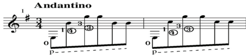
Görsel 8. Una Limosna por el Amor de Dios'un bas motifi

Barrios hayatının son döneminde, bir tremolo parçası olan ve teknik ustalığın bir göstergesi olan Una Limosna por el Amor de Dios (An Alm for the Love of God) isimli eserini bestelemiştir. Eser, soprano partideki tremolo ezginin, orta partideki ritmik ostinato 4 figürüyle desteklenmesinden oluşmuştur. Görsel 8'de ostinato motifi net bir şekilde görülmektedir.