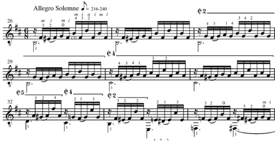
Görsel 7. Allegro Solemne bölümü 26-34. ölçüler, 16'lık notalardan oluşan arpej

Görsel 7'de Allegro Solemne bölümündeki, 16'lık notalardan oluşan arpej ise, o büyük, ruhsal katedral atmosferinden çıktıktan sonra, bir itiş kakıştan başka bir şey olmayan gerçek dünyayı canlandırır (Stover, 1992, 210). Eserin teknik yapısı Bach'ın yazı stilinden etkilenmiştir ve Barrios'un müzikal olarak en derin ve teknik bakımdan da virtüözite isteyen eserlerindedir.