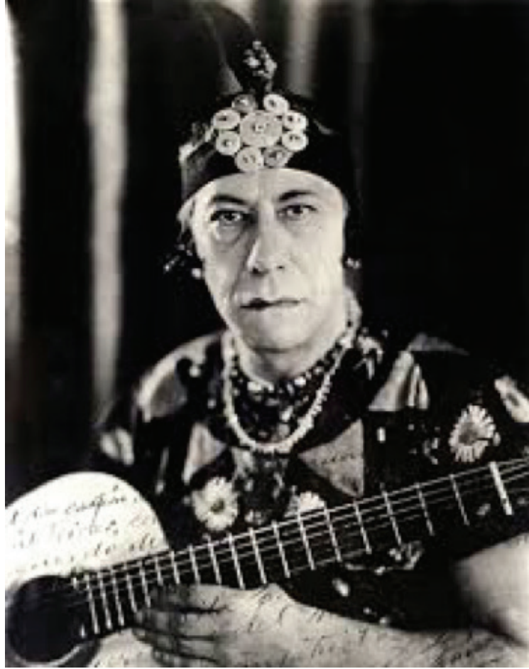
Görsel 5. Barrios Guarani geleneksel elbisesiyle

Barrios bu karaktere bürünerek daha fazla ün salmış ve bu şekilde atalarına takdirini belirtmiş olacaktı. Chief Nitsuga olarak verdiği konserlerde Barrios, sahneye Guarani geleneksel elbiseleriyle çıkıyordu. Barrios, bu performanslarında, daha tiyatral bir karakter yaratmak amacıyla, Chief Nitsuga Mangore kişiliği altında kendisini sahneliyordu. Nitsuga, Agustin'in tersten okunuşundan ve Mangore ismi de tarihi bir figür olan Timbues kabilesinin lideri Chief Mangore'un isminden geliyordu. Barrios ilk olarak, 1930 yılında Brezilya'nın, Bahia şehrindeki konserinde kendini bu şekilde tanıtmıştır (Stover, 1992, 210). Görsel 5'te Barrios'un geleneksel Guarani elbiseyle bir fotoğrafı yer almaktadır.