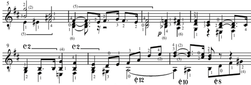
Görsel 6. Andante Religioso 5-11. ölçüler (yatay akorlar)

Görsel 7'de Allegro Solemne bölümündeki, 16'lık notalardan oluşan arpej ise, o büyük, ruhsal katedral atmosferinden çıktıktan sonra, bir itiş kakıştan başka bir şey olmayan gerçek dünyayı canlandırır (Stover, 1992, 210). Eserin teknik yapısı Bach'ın yazı stilinden etkilenmiştir ve Barrios'un müzikal olarak en derin ve teknik bakımdan da virtüözite isteyen eserlerindedir.