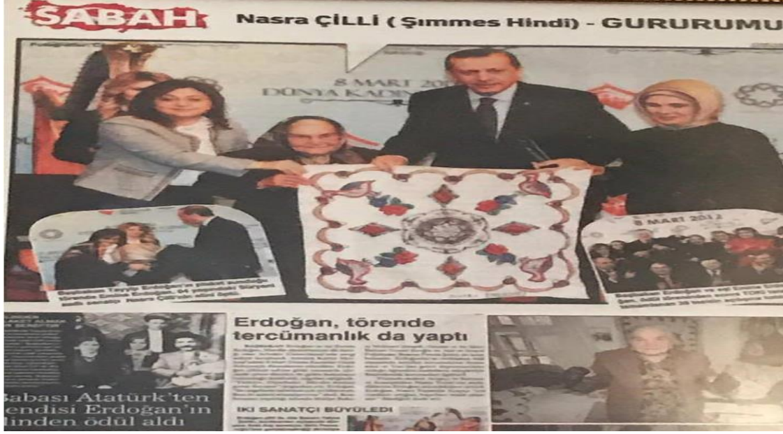
Fotoğraf 16: Miksiye Nasra Şimmes Hindi'nin 2012 Yılında Dönemin Başbakanı Recep Tayyip Erdoğan'dan "Yılın Kadını" Ödülünü Alması