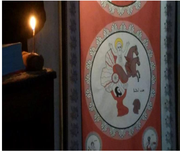
Fotoğraf 1-2: Mardin-Midyat Bethkustan Köyü Mor Eliyo Kilisesi'ndeki Sürekli Kullanımda Olan Perdeler (Adem Çoşkun Arşivi)